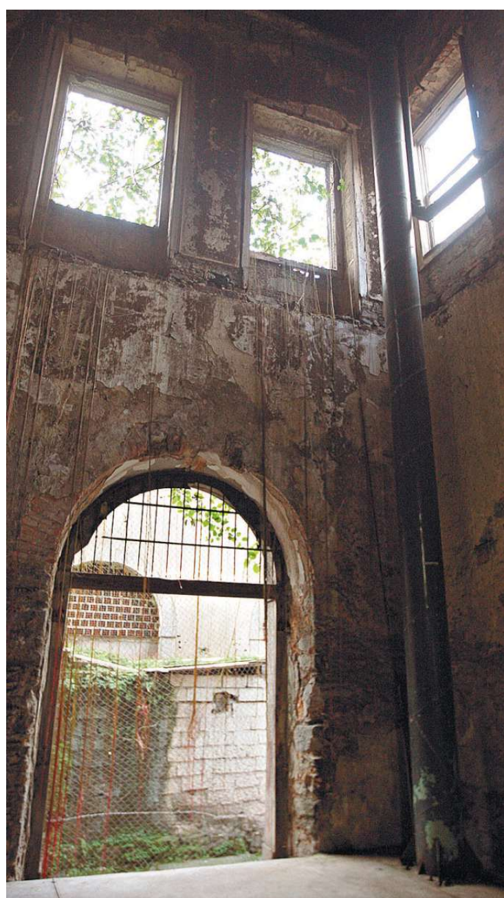
Restauro manterá características originais do imóvel, do século 19

Localizada na Rua do Comércio, 96, a Casa de Frontaria Azulejada foi construída em 1865 para servir de residência e armazém do comerciante português Manuel Joaquim Ferreira Netto. A fachada foi feita em estilo neoclássico. Porém, os mais de 7 mil azulejos que caracterizam o imóvel, foram colocados apenas após a morte do proprietário pelo seu sócio, Luís Guimarães. A porta principal, bastante larga, permitia o acesso de carruagens ao interior do casarão, enquanto o andar superior tinha nove portas, divididas em três sacadas voltadas para a rua.