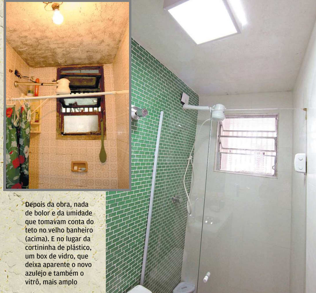
Depois da obra, nada de bolor e da umidade que tomavam conta do teto no velho banheiro (acima). E no lugar da cortininha de plástico, um box de vidro, que deixa aparente o novo azulejo e também o vitrô, mais amplo