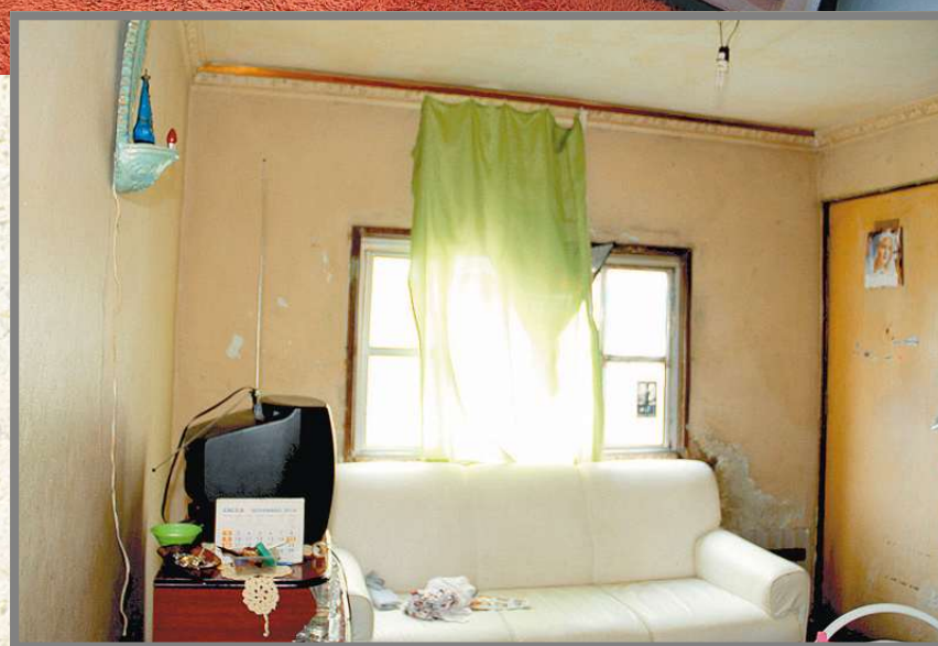
A própria dona da casa queixava-se muito do antigo piso do local (foto ao lado), com tacos de madeira e desgastados. Agora, todos os cômodos estão revestidos com piso porcelanato. Na sala, logo na entrada da moradia, quadros, poltronas e pintura novas

A pretensão das proprietárias é fazer uma nova edição do projeto Sonhos D'Casa a cada seis meses.