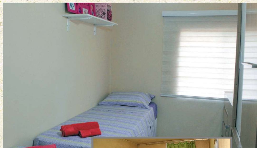
No quarto que ela vai dividir com a mãe, paredes novas e pintadas de cores claras, guarda-roupas, cômoda e duas camas de solteiro irão garantir o conforto às duas