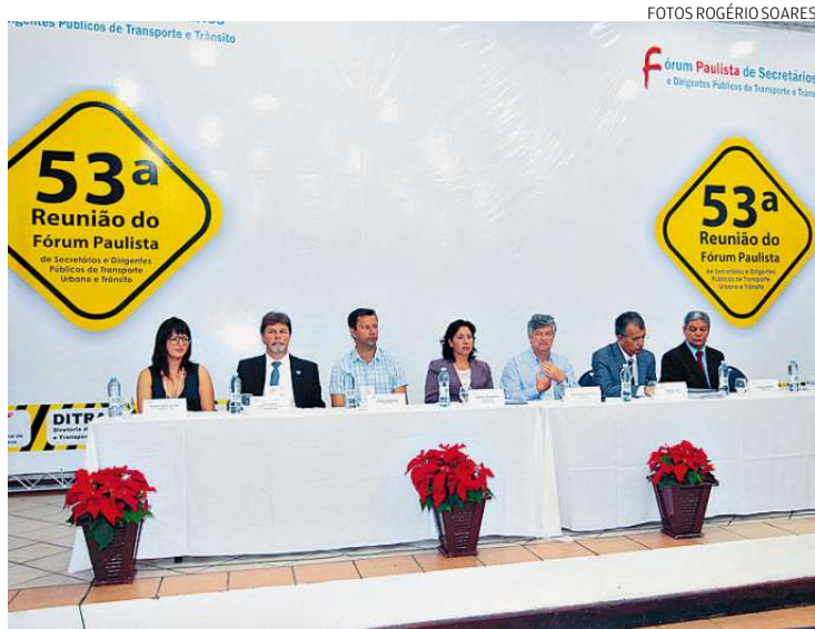
Fórum Paulista de Transporte e Trânsito discute soluções para o setor

Por último, a Construcciones y Auxiliar de Ferrocarriles S.A., que questionou o caso na Justiça. “Nós recorremos, publicamos a classificação técnica com 1º, 2º, 3º e 4º lugares para não ter problema. A Justiça entendeu que a EMTU estava correta e, portanto, nós publicamos. Agora é aguardar o prazo até amanhã (hoje), às 17 horas. Depois disso já pode ter