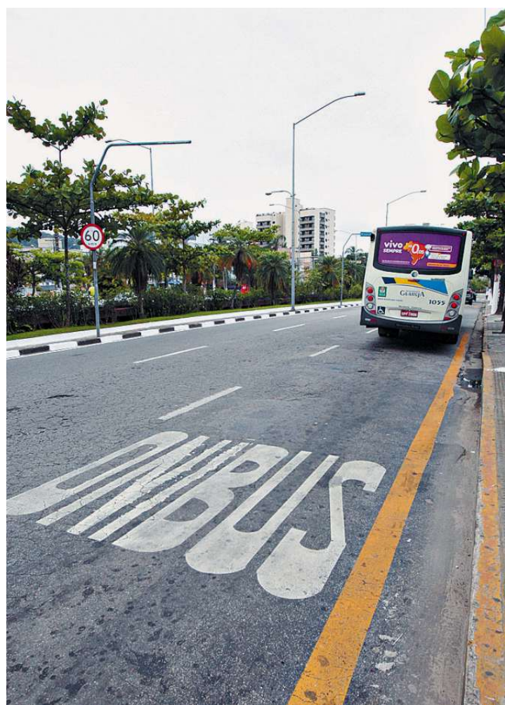
Av. Dom Pedro I ganhará faixa para passagem exclusiva de ônibus

O que ofereceu o menor preço é o Consórcio Sice, formado pelas empresas Sice do Brasil e Sociedad Ibérica de Construcciones Eléctricas. O valor é de R$ 92,4 milhões, 46% a menos do que a proposta inicial.