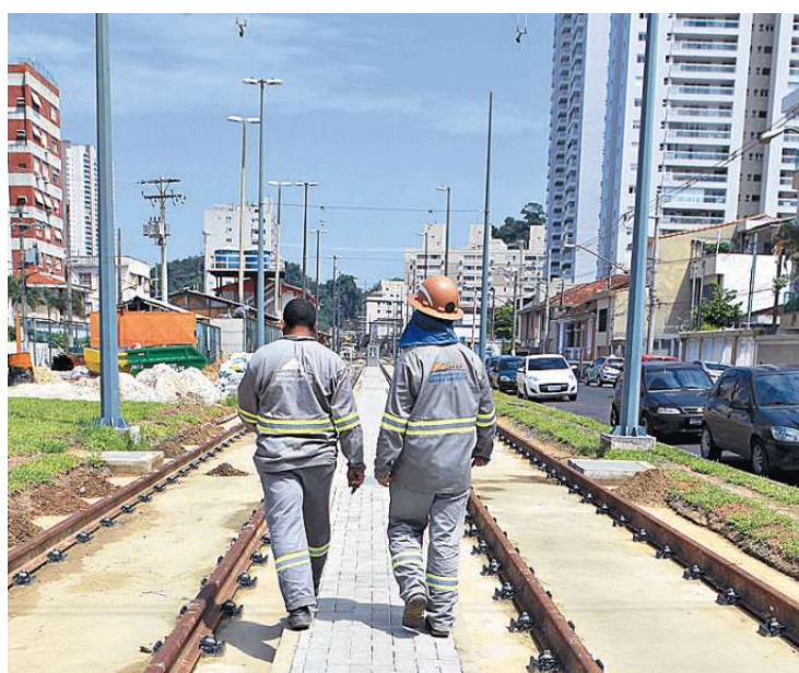
As obras continuam no trecho próximo à Estação Pinheiro Machado

O relatório de Cavalheiro publicado na última semana afirma ainda que o impacto desta mudança deve ser avaliado, pois "além do (impacto) urba-