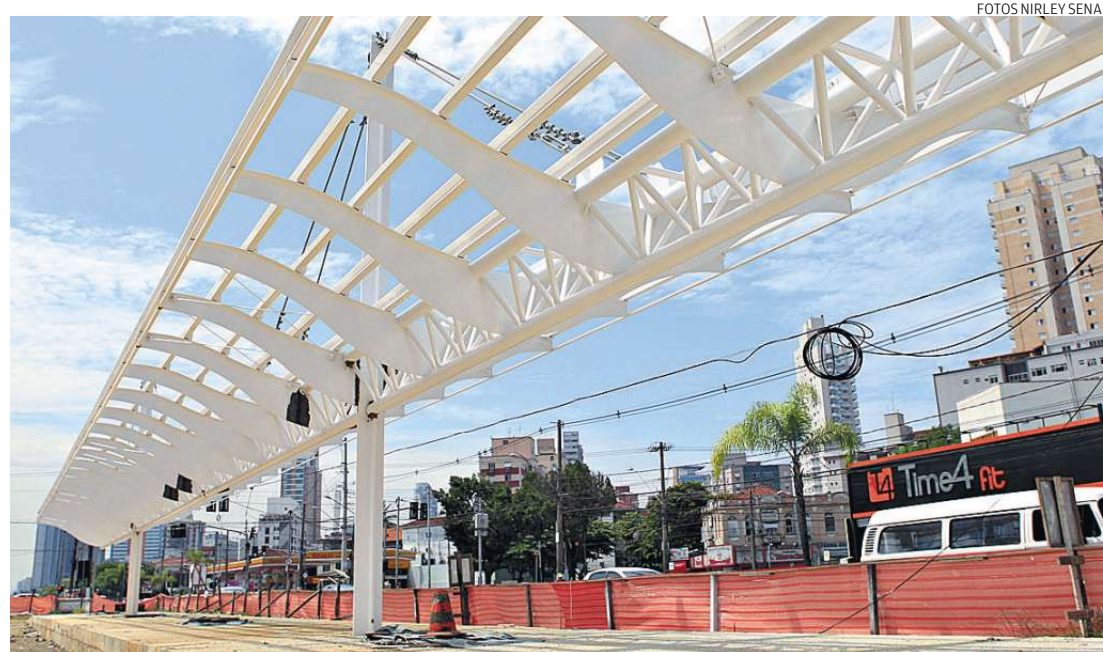
A Estação Bernardino de Campos, próxima ao Canal 2, está localizada no trecho interditado pela Justiça

O VLT deve transportar cerca de 70 mil usuários por dia. A experiência de ligar duas cidades é inédita no País. O percurso será feito em cerca de 30 minutos.