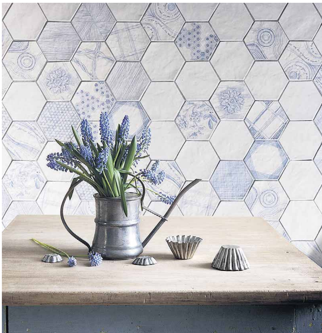
↙ Azulejos hexagonais artesanais da italiana Ornamenta. Ao lado, cerâmica para paredes Vintage Antique, da Level, medindo 20 x 20 cm. Abaixo, coleção Rendas, de pastilhas de porcelana esmaltada, da Jatobá