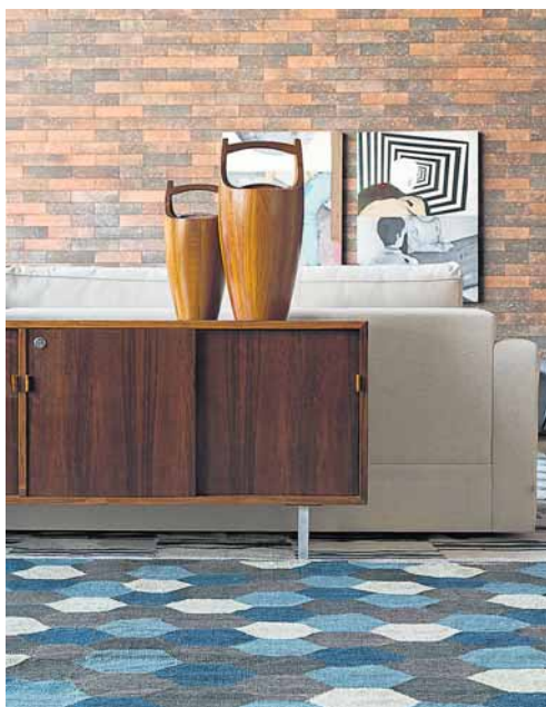
↳ Detalhe do buffet e tapete com hexágonos da By Kamy. Ao lado, estar com mesa de centro de fibra de vidro e sofá de linho da Dpot