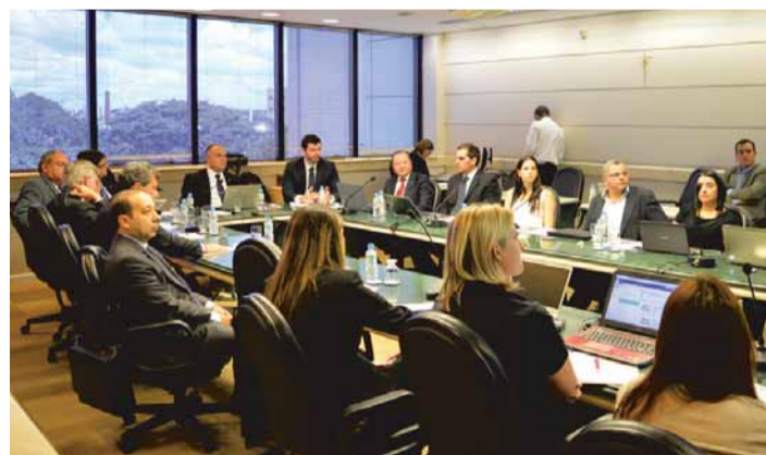
SESCON-SP sediou reunião do GTC do eSocial no dia 9 de fevereiro

O manual e as principais perguntas e respostas sobre o sistema já estão disponíveis no endereço: www.esocial.gov.br .