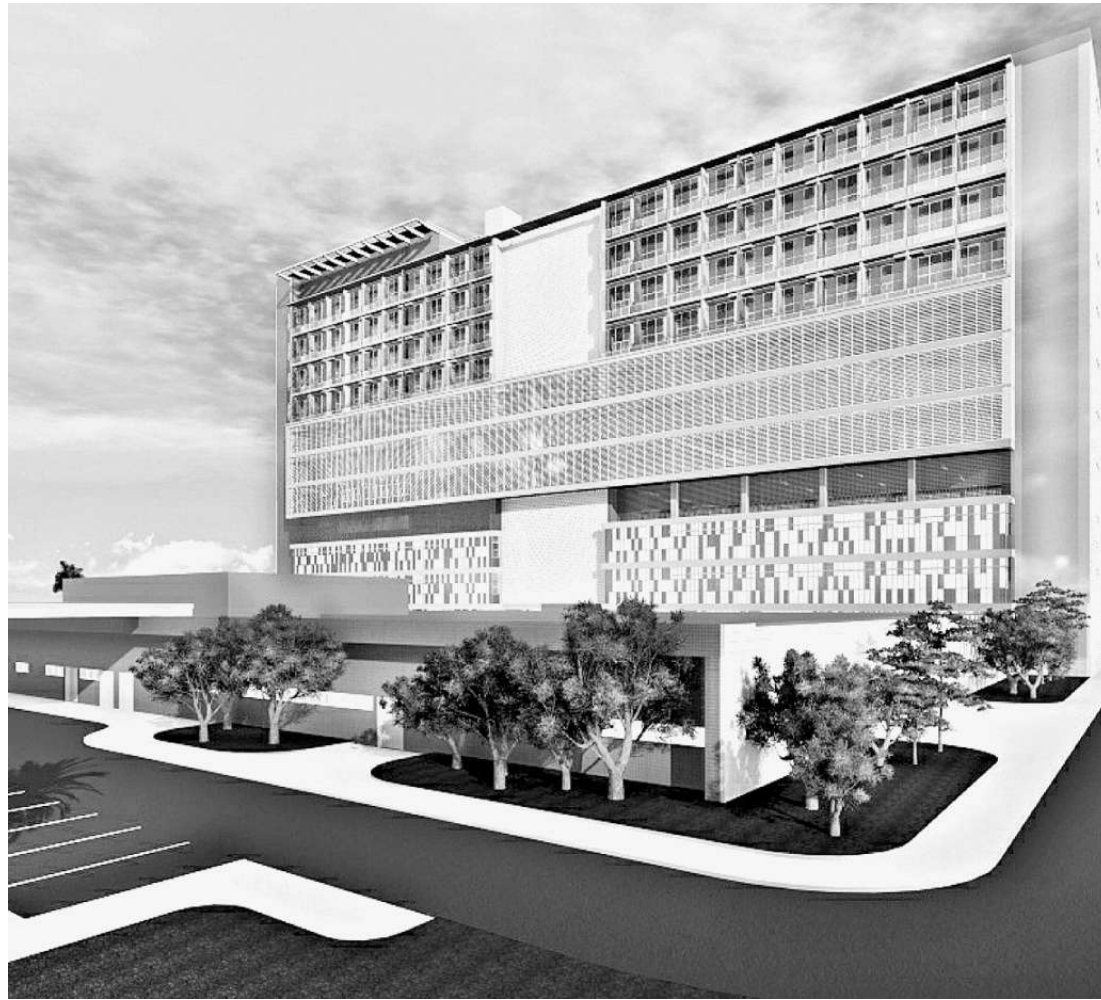
O projeto entregue pela Prefeitura ao ministro Arthur Chioro, em janeiro deste ano: articulação adiantada

Um leito hospitalar normal custa, no mercado, até R$ 10 mil. Fazendo a mesma operação de multiplicação, pelas 320 vagas do hospital vicen-