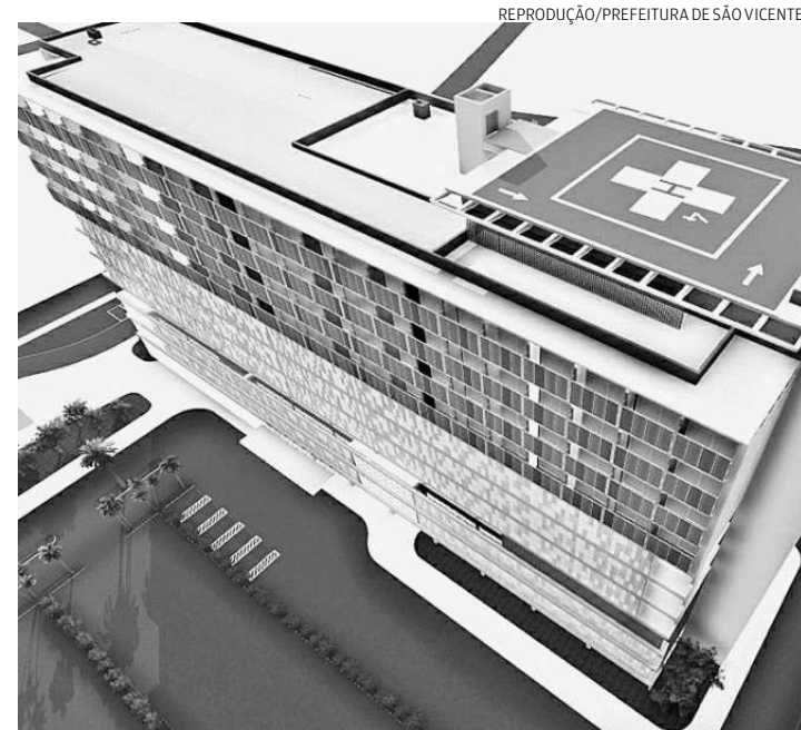
São 10 andares, 400 leitos, e um valor estimado em R$ 150 milhões