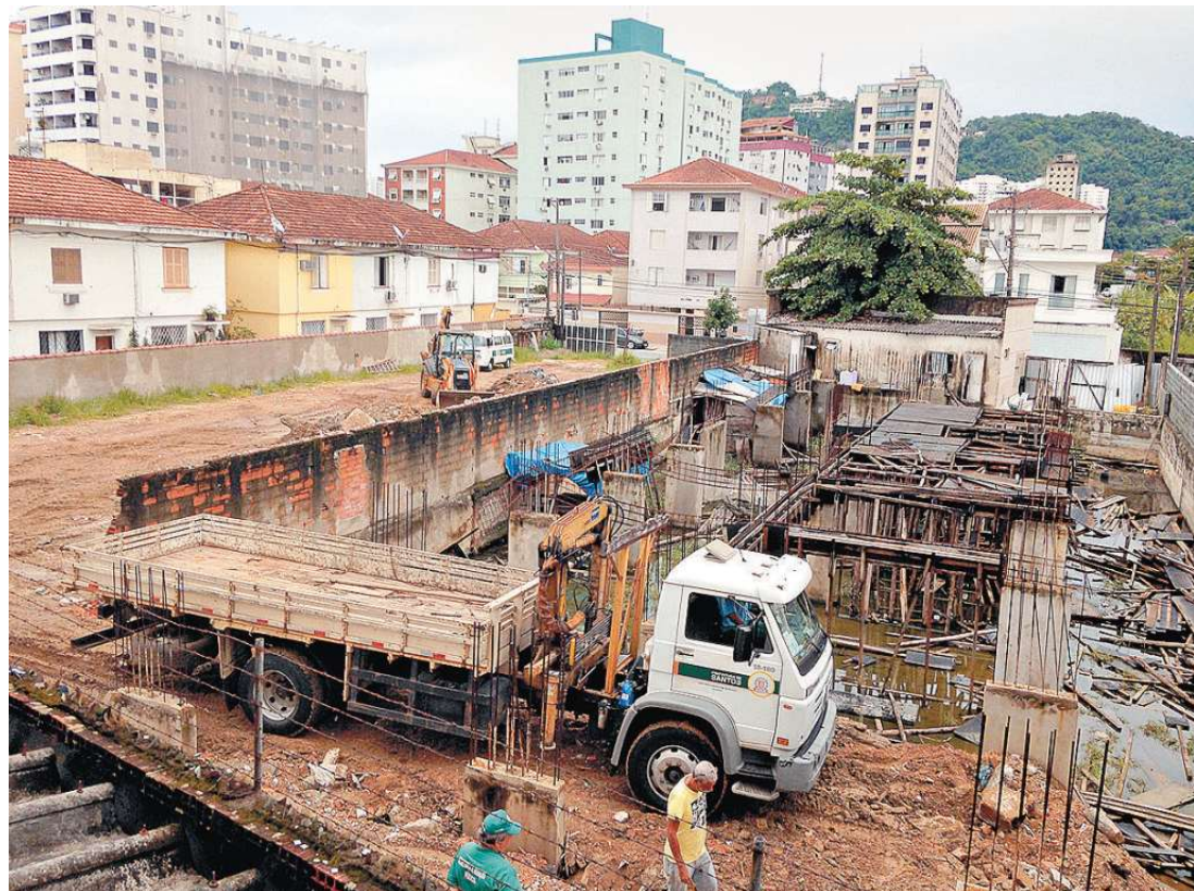
Na Rua Teixeira de Freitas, no Campo Grande, edifício que seria construído não passou da fundação

E alerta: “Muitas construtoras usam até placa da Caixa (Econômica Federal), mas não têm nenhum convênio. Ai recebem o dinheiro, somem e acabam. Você perdeu tudo”.