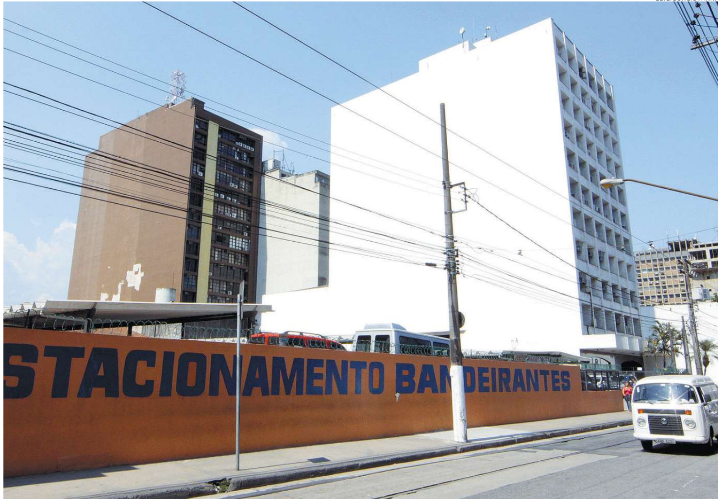
Segundo o Condepasa, o terreno onde há um estacionamento na Rua General Câmara, que é NP3b, pode abrigar um edifício, como o ao lado

Quando se investe em um imóvel do Alegre Centro, o poder público oferece diversas isenções fiscais. Na lista estão a isenção total da Taxa de Licença de Localização e Funcionamento; a isenção parcial do Im-