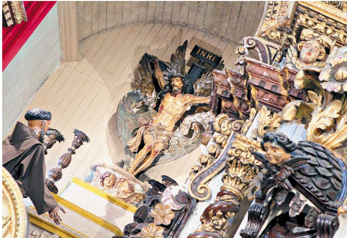
Uma das riquezas iconográficas é o Cristo, envolto por seis asas, considerado o único do tipo no Brasil

O imóvel abriga o retábulo do altar-mor, tombado pelo Instituto de Patrimônio Histórico e Artístico Nacional (Iphan). Em estilo barroco, nele está a imagem de São Francisco, em tamanho natural, orando diante de um Cristo místico alado (a única imagem com seis asas existente no Brasil, de influência espanhola).