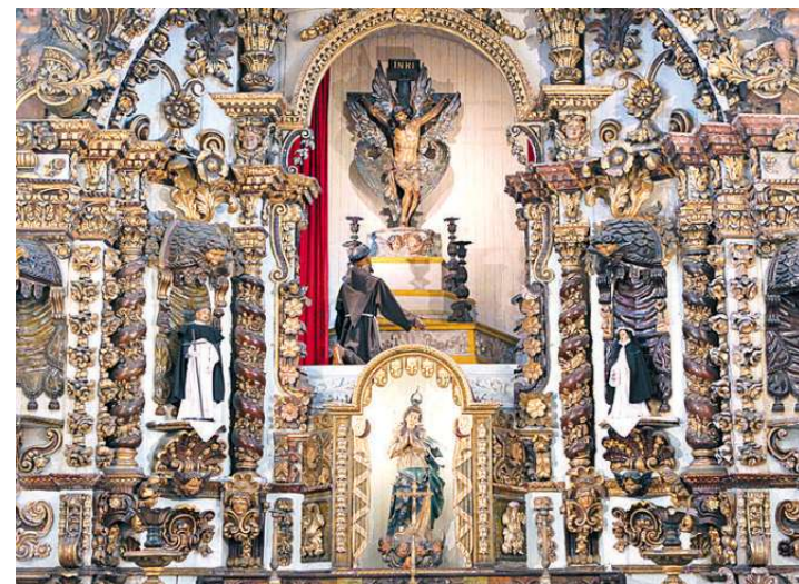
O altar por inteiro: um primor do estilo barroco em cada detalhe