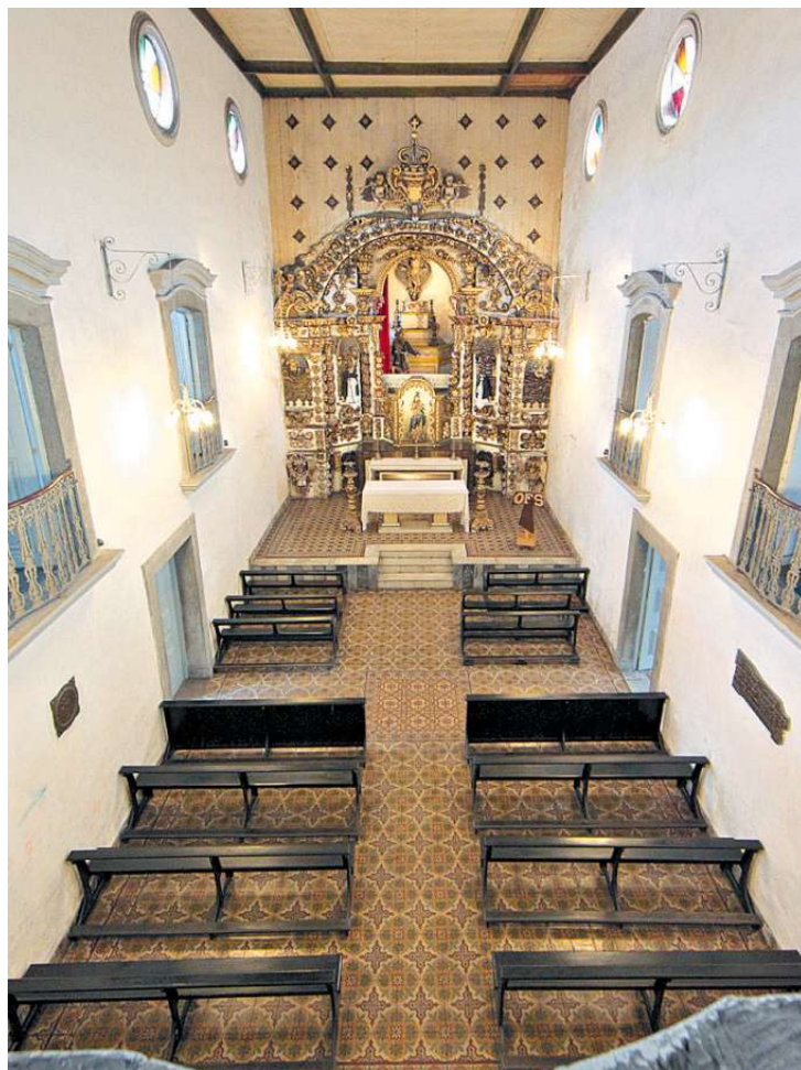
Vista geral da capela, que precisa passar por intervenções estruturais