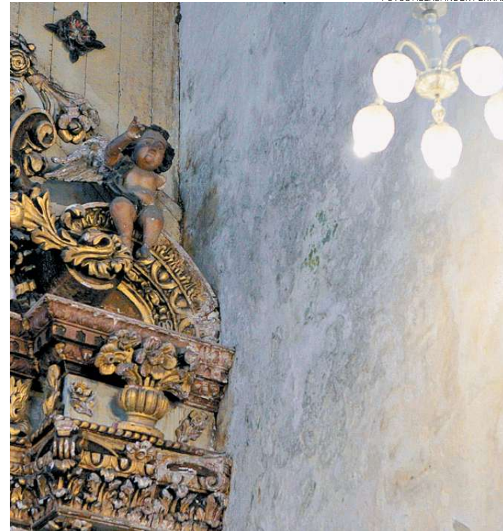
O detalhe dos sinais de infiltração nas paredes: renovação é vital