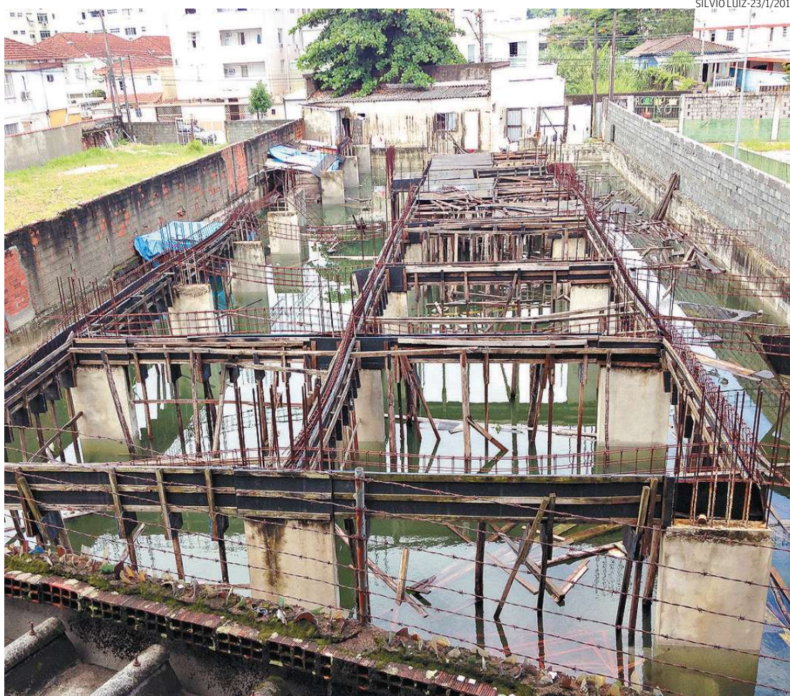
O terreno abandonado também trouxe apreensão à vizinhança, especialmente pelo temor da dengue...

“É possível estimar que a construtora embolsou algo próximo a R$ 6 milhões de dezenas de famílias se consideramos a média de R$ 100 mil por apartamento disponível para venda”, afirma Spinelli.