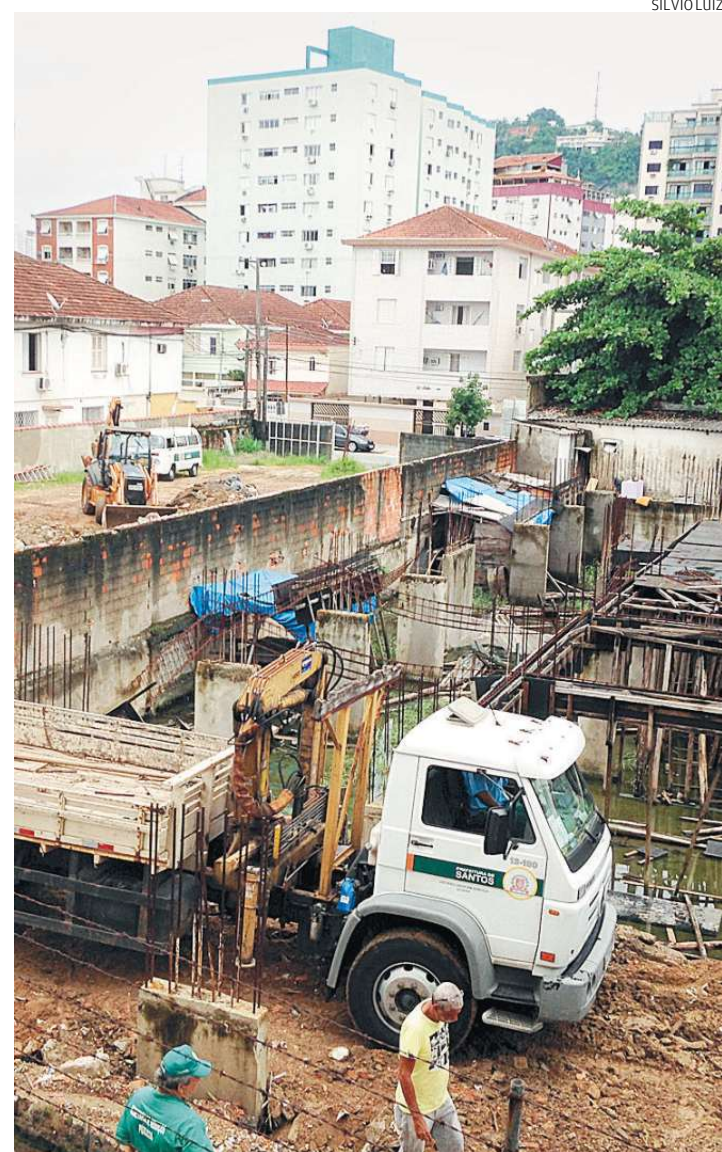
... por isso, Prefeitura procedeu ao aterramento do local