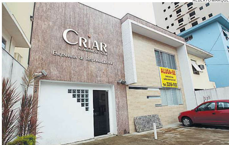
Na sede da empresa, placa de “aluga-se” e aparência de abandono

Questionado sobre como a Criar estava vendendo em 2011 um empreendimento que se-