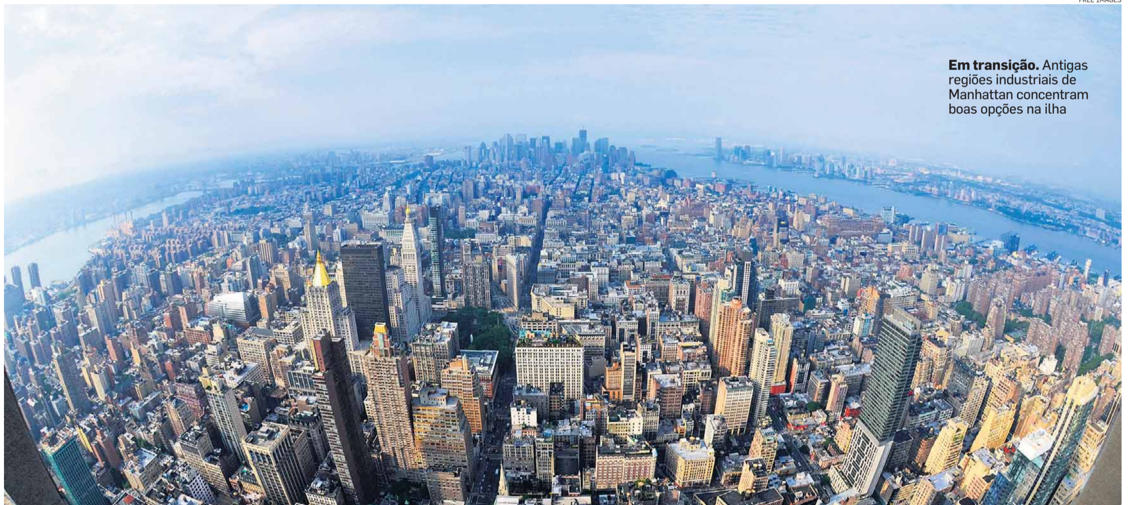
Em transição. Antigas regiões industriais de Manhattan concentram boas opções na ilha