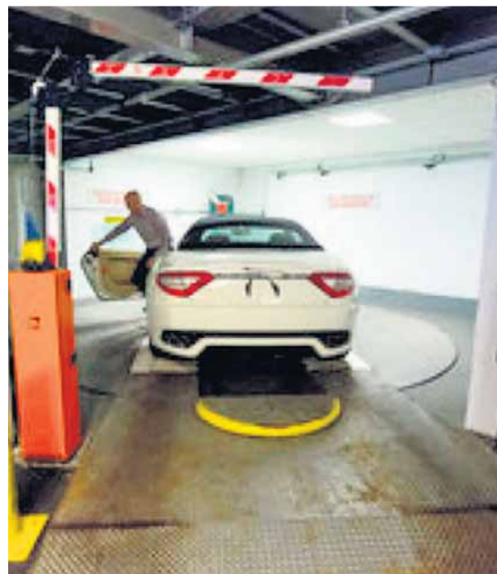
Pacote. Moradores de apartamento de US$ 4,8 milhões contam com valet mecanizado

O sistema mais barato no mercado da cidade no fim do mês passado estava na avenida DeKalb, 1619, Brooklyn, no condomínio LLofts, onde uma unidade com dois dormitórios e dois banheiros podia ser comprada por US$ 749 mil. O estacionamento do LLofts, numa