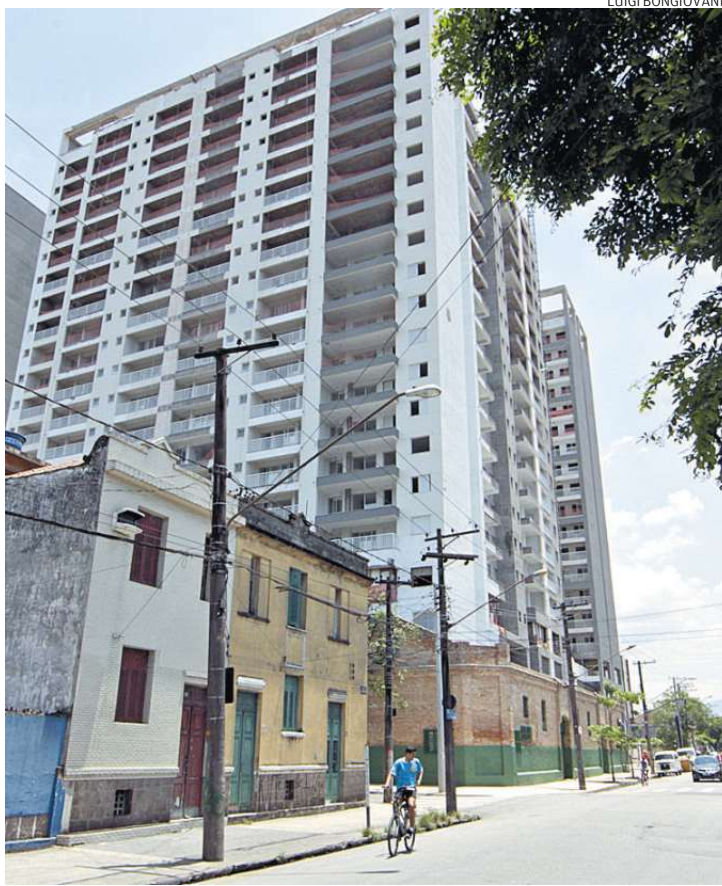
Novas construções na área das ruas Silva Jardim e Campos Melo

A Reportagem constatou o excesso de matagal e lixo, na