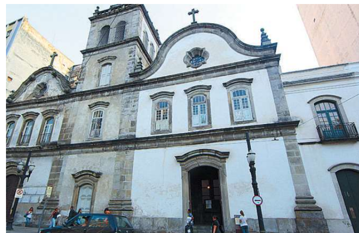
A torre e central do Conjunto; a parte do convento fica à direita

O Conjunto do Carmo fica na Praça Barão do Rio Branco, 16. Está aberto à visitação diariamente, das 7h30 às 18 horas.