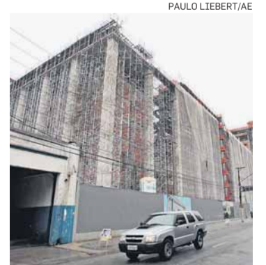
Templo de Salomão. Obra é erguida na Av. Celso Garcia

prir exigências da CET para poder abrir as portas. Tanto a da Universal quanto a da Assembleia já têm as medidas previstas para reduzir o trânsito. O pacote não sai do básico: novos semáforos, placas e guias rebaixadas. Segundo a lei dos polos geradores de tráfego, a conclusão dessas obras libera o processo de regularização dos templos. /A.F. e E.V.