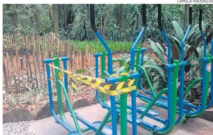
Trianon. Parque em região nobre de SP sofre com abandono