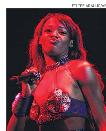
Azealia Banks. Rapper acendeu o pavio da noite

Mas os fãs que tomavam as pistas dos palcos Principal e Indie não pareciam preocupados. O quinteto The Drums surgiu às 20h45 no Palco Indie. Virou apenas boa diversão, talvez a única pretensão da banda. Antes do anoitecer, um Lexotan sonoro tomou conta do festival. Best Coast fez um bom show, mas ficou nos andamentos letárgicos,