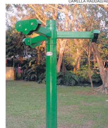
Ibirapuera. Faltam cabos para a torre de exercícios

parque diariamente têm um palpite. “Como está em espaço muito aberto, quase na rua, os carroceiros tentam arrancar o ferro para vender”, afirma um estudante de 20 anos que preferiu não se identificar. No Piqueri, zona leste, peças estavam encostadas em um canteiro de obras e no Ibirapuera, na zona sul, havia