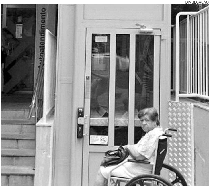
Casimirthes não pôde entrar no banco porque elevador estava parado

automática. Os proprietários terão de solicitar os benefícios no prazo de quatro meses após a publicação em Diário Oficial.