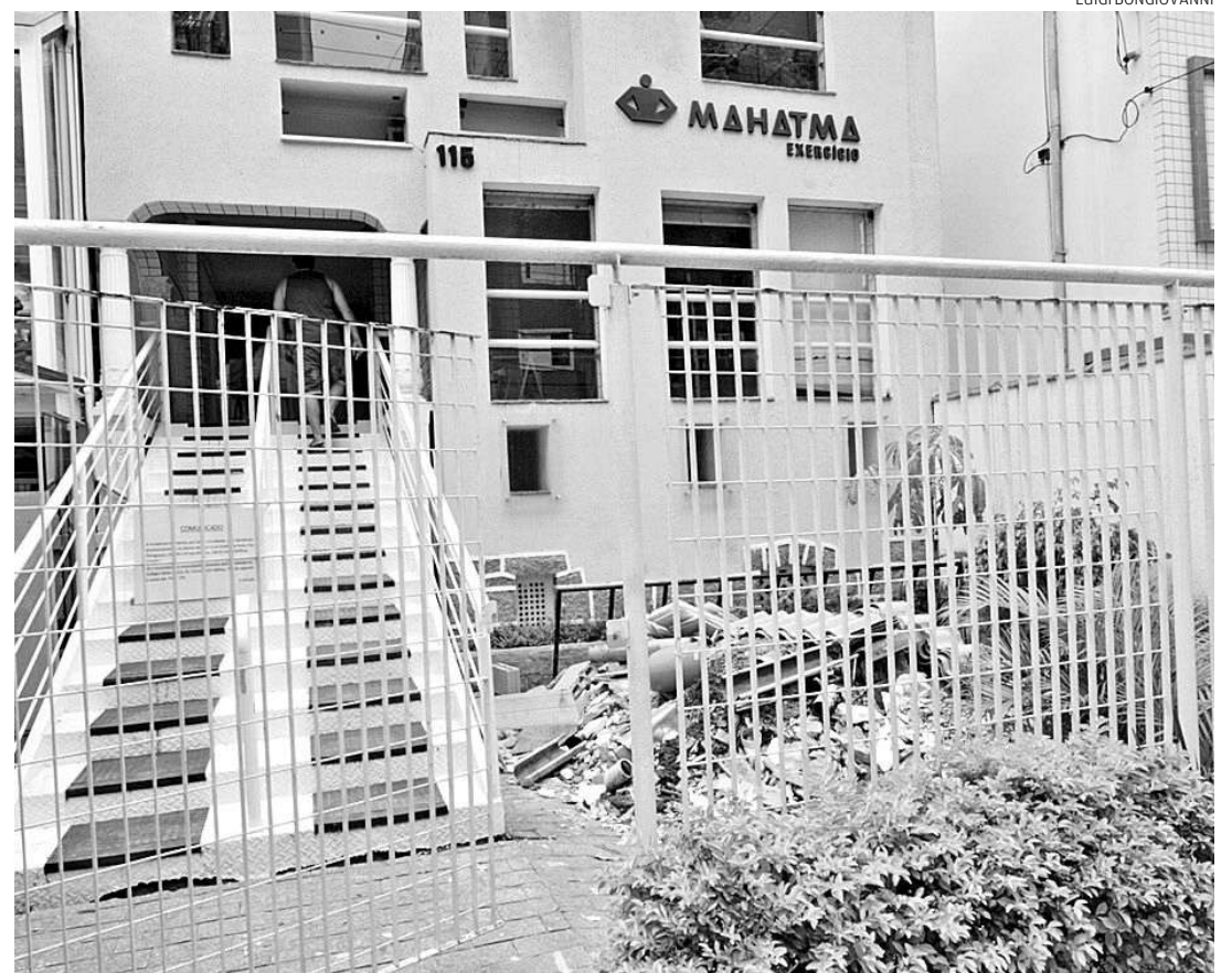
A fachada da academia Mahatma ainda acumula entulho do acidente, que completa 4 meses no sábado

dado entrada na Câmara esta semana, ainda não há prazo de quando será analisado pelos vereadores, pois ainda deve passar por comissões da Casa. Como as