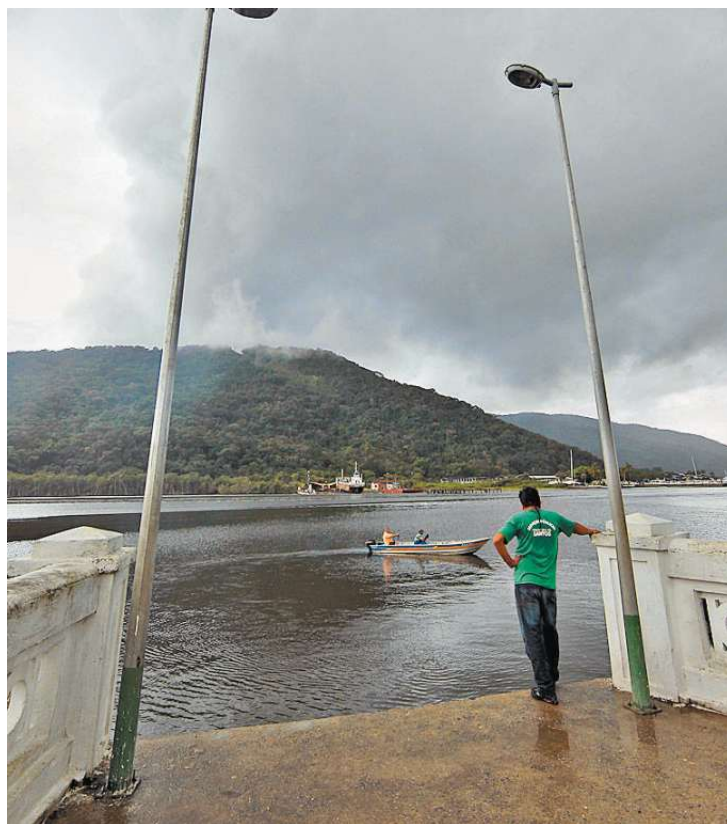
O Portinho (acima), às margens do Canal de Bertioiga, é um tipo de cartão postal do bairro, onde a luz elétrica só chegou em 1989

Observando o mapa, percebe-se que o bairro, cortado por rios e repleto de manguezais, floresta de restinga e floresta ombrófila, já é densamente povoado, sendo poucas as áreas que podem abrigar algum projeto.