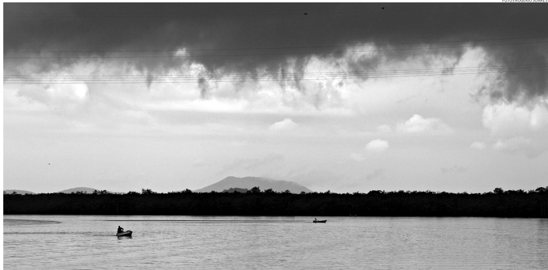
Há apenas 1.120 habitantes no bairro (Censo IBGE 2010), que fica a 60 km do Centro - é um dos mais distantes. Abriga gente oriunda da vizinha Bertioiga e de Guarujá

Para orientar quem pretende investir na região e ajudar as equipes que fazem fiscalização, a Prefeitura produziu a carta am-