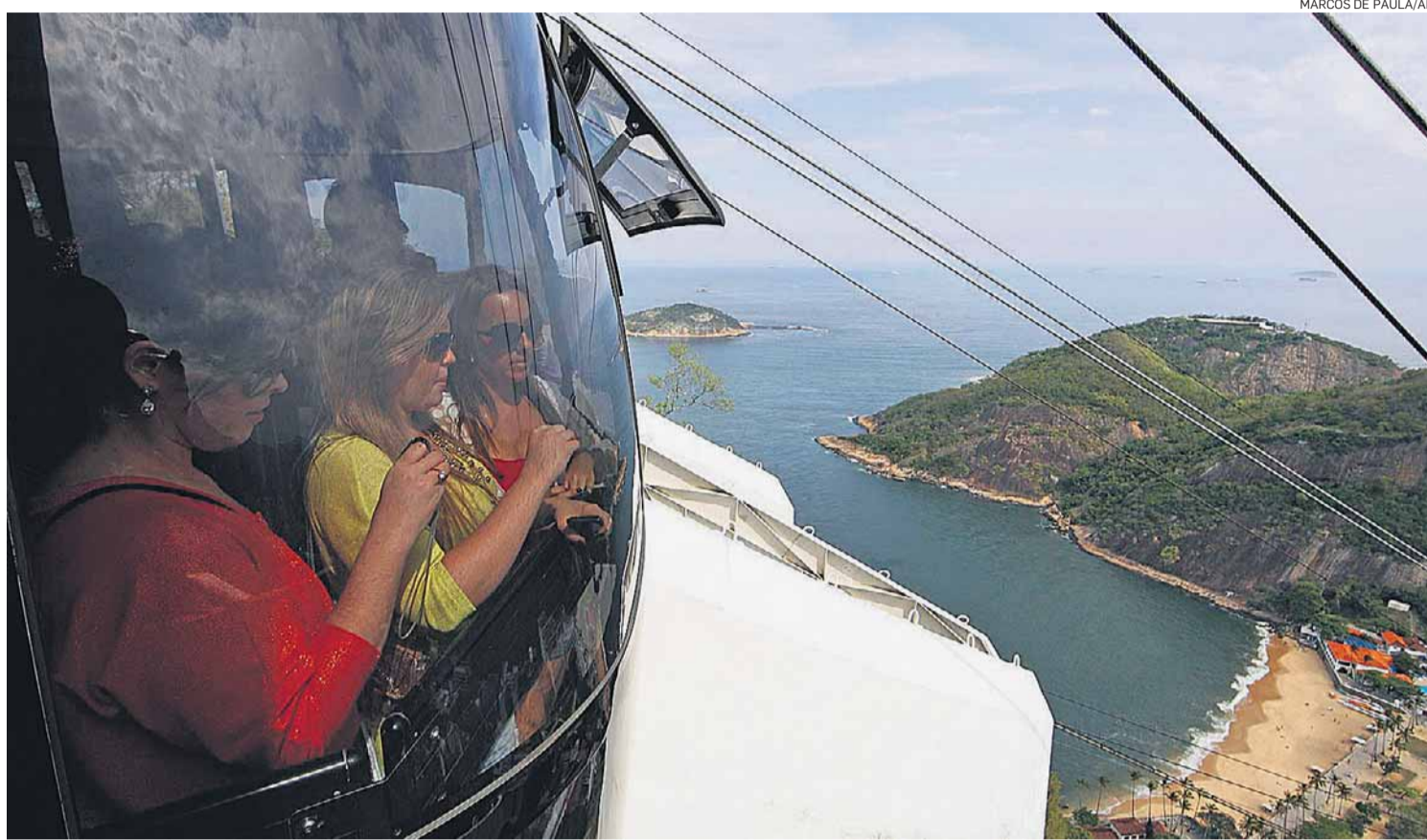
Nas alturas. Paisagem deslumbrante encanta os turistas, mas muitos se queixam dos preços do ingresso e dos produtos

Um sistema semelhante ao espanhol deve ser inaugurado em dezembro, mas hoje apenas oito bilheterias atendem