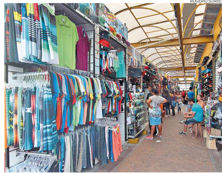
O projeto da Prefeitura é ampliar e modernizar a estrutura do local

“É uma pré-proposta, um norte que gostaríamos de seguir. Mostramos tudo detalhadamente, com croquis e perspectivas, para que todos entendessem a nossa intenção”, co-