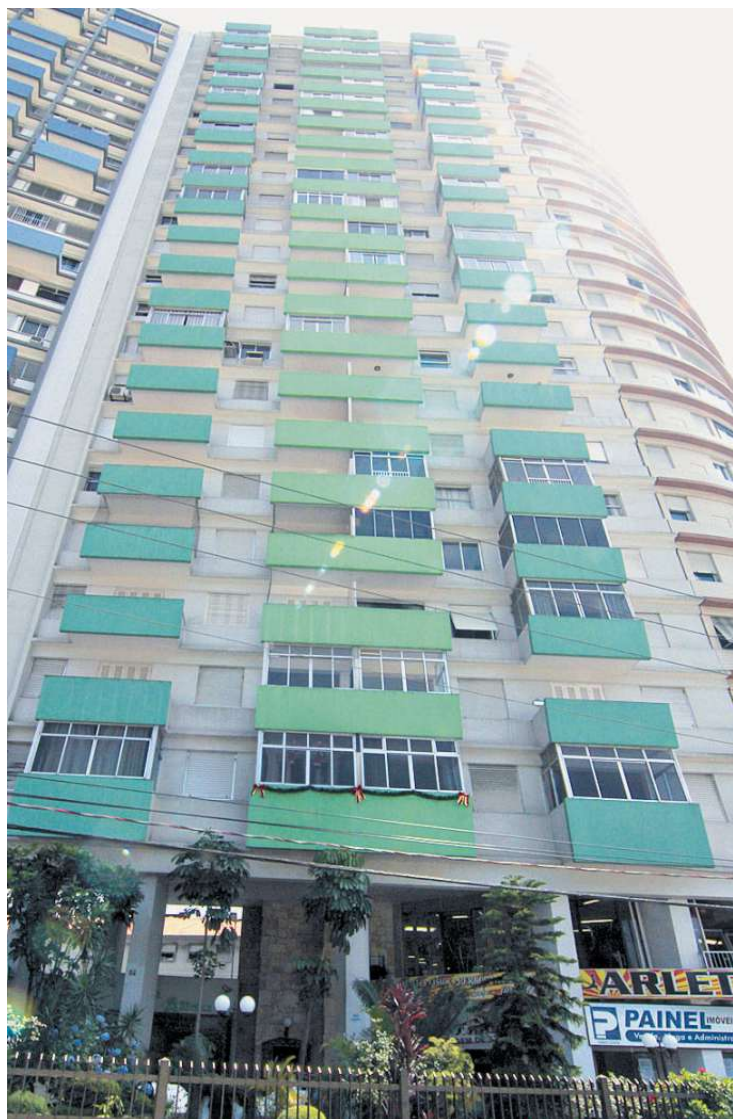
Edifício Costa Atlântica, de 22 andares, foi erguido há mais de 60 anos

Segundo eles, por ser um prédio com mais de 60 anos, é impossível cumprir todas as adequações solicitadas - incluindo colocação de hidrante com fonte de abastecimento de água específico, escada de incêndio, corrimão duplo e porta corta fogo. Mas as medidas ini-