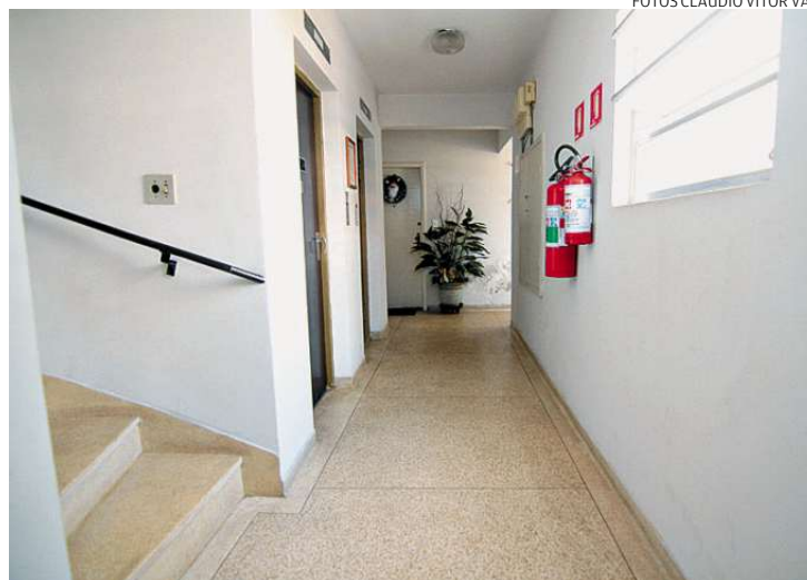
Corrimãos duplos e escada de incêndio, por exemplo, são exigências

mos o mesmo documento na semana passada ao Corpo de Bombeiros, mas ainda não tivemos resposta. Não estamos de braços cruzados", diz a advoga-