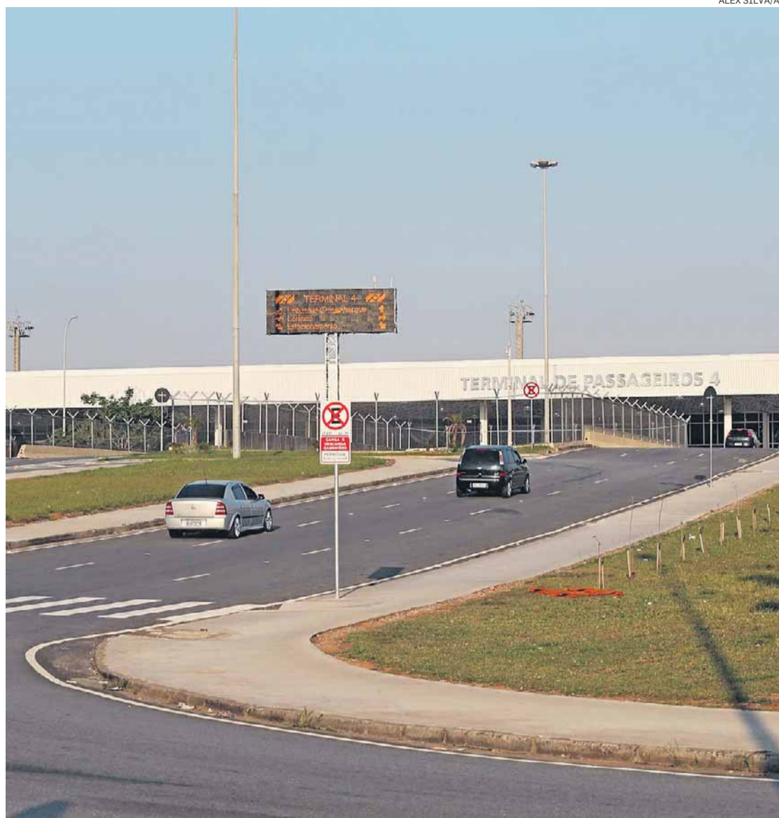
Terminal 4. Início da construção da Linha 13 ficou para o primeiro semestre do próximo ano

Procurada pela reportagem, a Concessionária Aeroporto Internacional de Guarulhos S.A. divulgou que ainda não definiu como pretende fazer o transporte dos