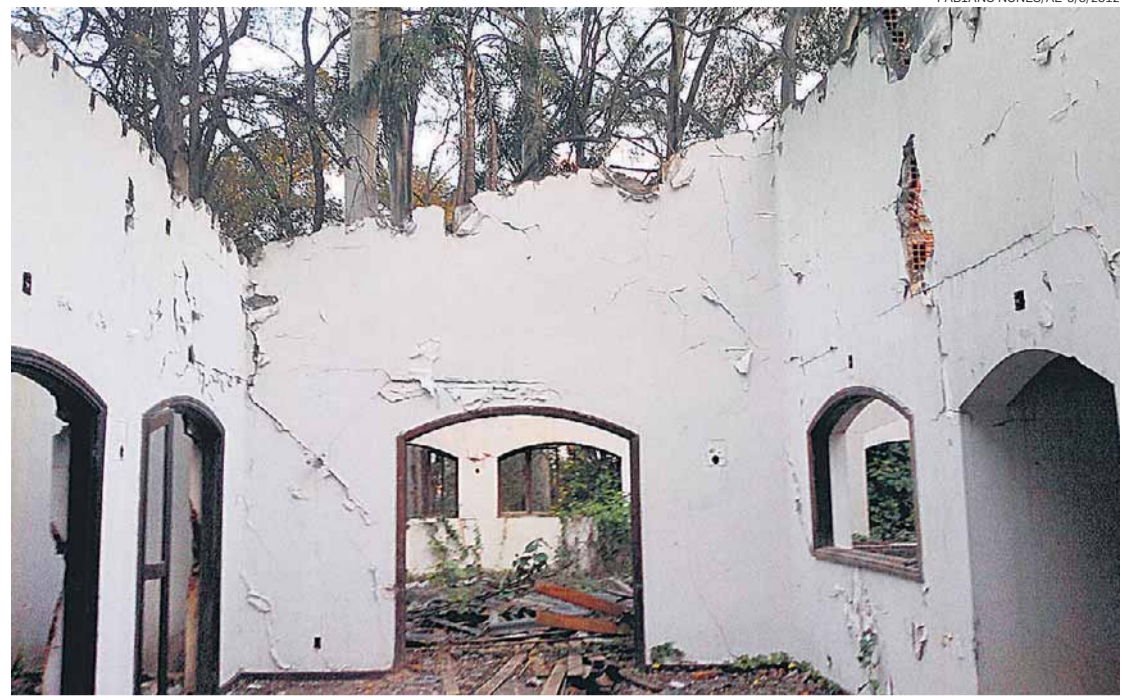
Ruínas. Situação atual é de abandono: paredes terão de ser demolidas durante a obra

A licença ambiental prévia da obra já foi emitida, mas os trabalhos de escavação do túnel ainda dependem de uma segunda licença para início dos serviços. A conclusão de todo o projeto, no entanto, depende diretamente da autorização judicial para desapropriação de cerca de 12 mil imóveis, entre casas antigas do Jabaquara e favelas.