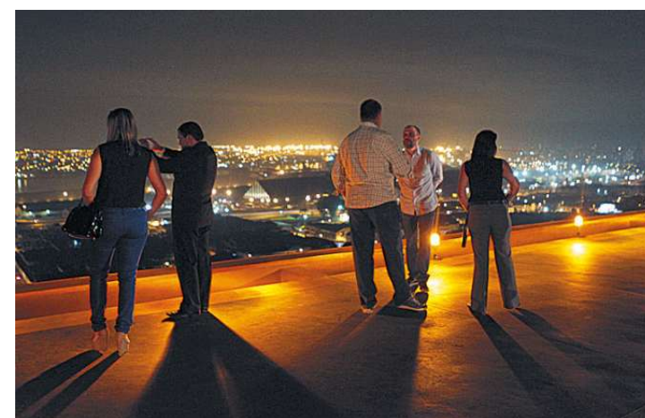
O Tribuna Square tem o primeiro heliponto do Centro, já homologado