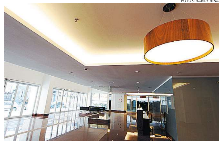
Sofisticação e tecnologia em cada detalhe, com destaque aos 15 elevadores

O sócio-diretor da AMC explica que o quarto pavimento deverá ser usado de forma ino-