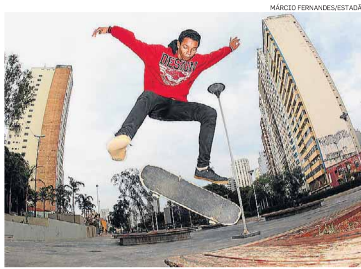
Manobra. Bancos de madeira serão trocados por metálicos

noite de ontem, consideraram boa a ideia de uma área exclusiva para eles na praça, com rampas e piso próprio. Mas acredi-