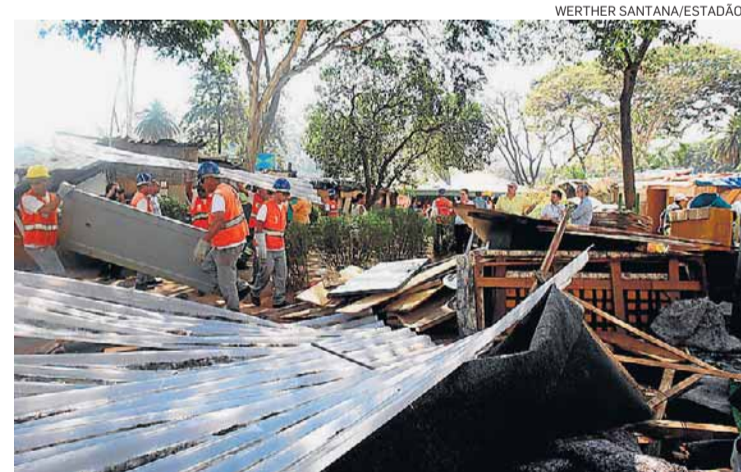
Retirada. Ação teve apoio da Guarda Civil Municipal

O programa se diferencia por acolher famílias, em vez de apenas homens solteiros, como a maioria dos abrigos. Segundo a Secretaria de Assistência Social, a proposta é criar um espaço que não é uma solução habitacional definitiva, mas também não é um acolhimento regular da Prefeitura.