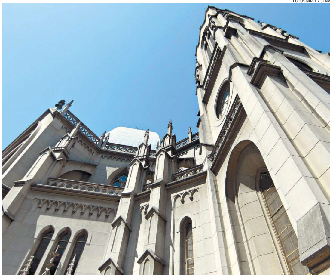
A construção da Catedral teve início em 1909, mas só foi concluída 58 anos depois, em 1967

Atualmente, existem 10 processos em estudo pelos membros do conselho. "Priorizamos o da Catedral, a pedido da Secretária de Cultura (Secult) e do próprio padre. Fizemos uma força-tarefa para concluir e atendê-los".