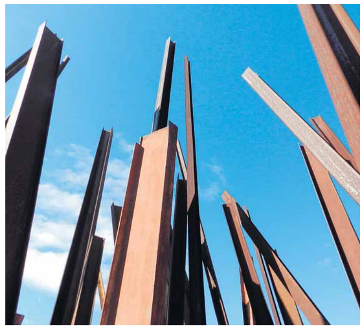
Chris Burden. Um guindaste jogou 71 estacas sobre o cimento fresco para criar a obra