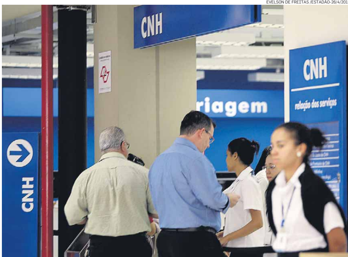
Detran. Promotor afirma que se constatou no Estado 'bloqueio sistemático de carteiras'

A investigação do MPE apontou que hoje são abertos no Estado 600 mil processos admi-