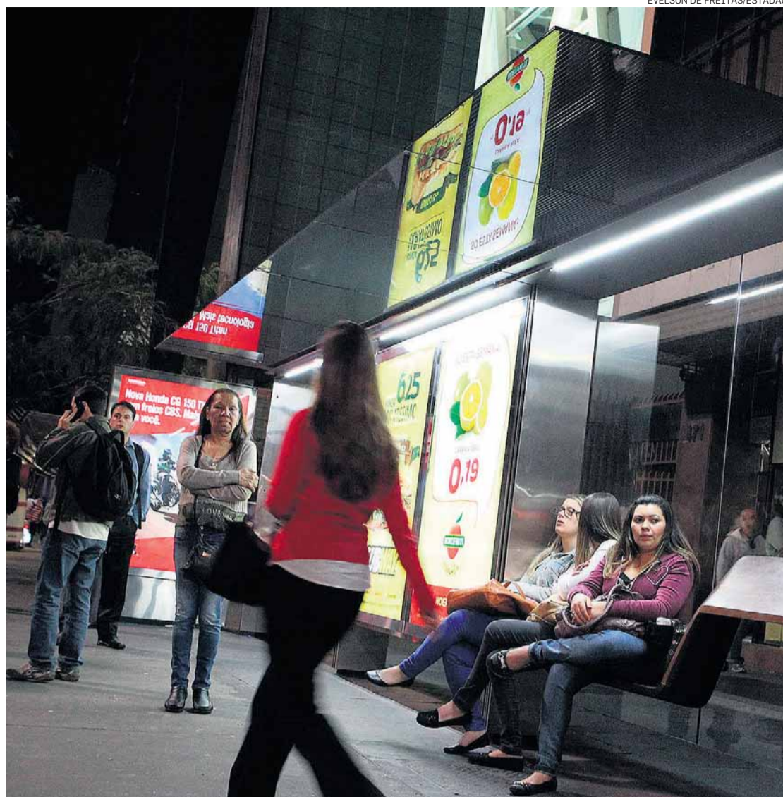
Iluminação. Um dos pontos de ônibus que receberam lâmpadas de LED na Paulista