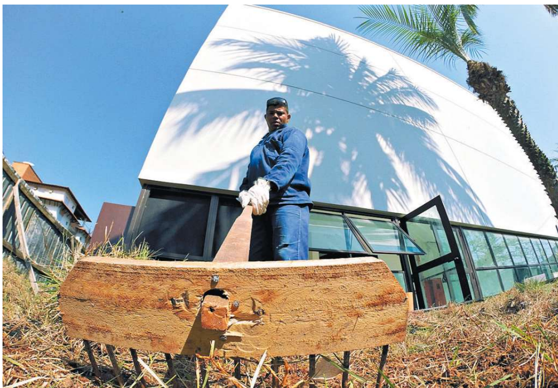
Durante a reforma, foi identificada a necessidade de alterar também a parte de infraestrutura tecnológica

obras estão adiantadas. Corrimões ainda embalados dividem espaço com carpetes recém-colocados, uma nova