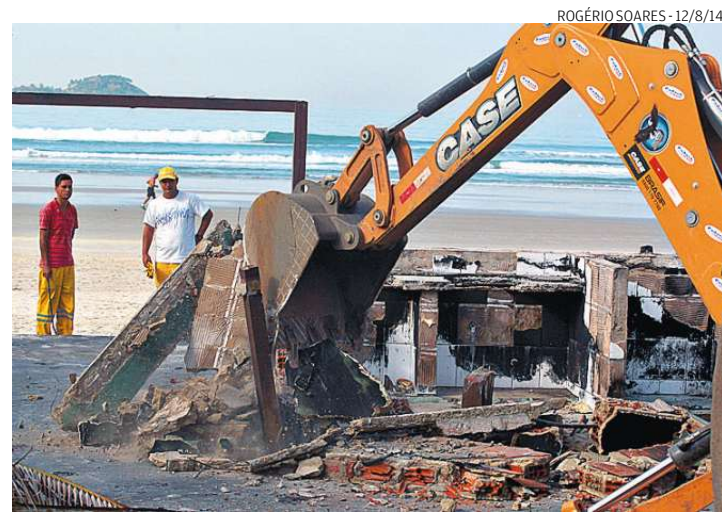
Prefeitura deve apresentar à Justiça Federal o esquema de demolição

“Assim que finalizar a remoção do material, a Administração providenciará as notificações para a continuidade das demolições. É importante ressaltar que a Administração preza pelo bom relacionamento com os quiosqueiros, procurando não prejudicar nenhuma das partes envolvidas neste processo de reformulação”,