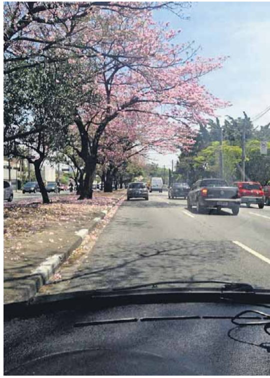
RENAM DE SOUZA

No meio do trânsito. Ipê-rosa na Avenida dos Bandeirantes, na zona sul da capital paulista. Foto de Renam de Souza.