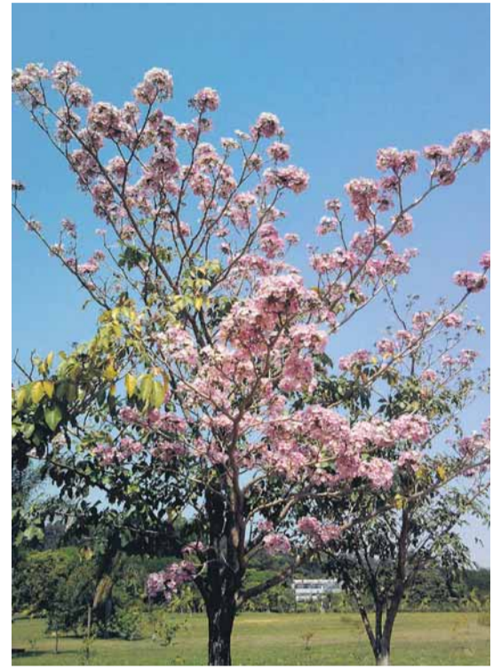
RENATA CELIA DE OLIVEIRA ANDRADE

USP. Ipê-rosa na Cidade Universitária, na zona oeste de São Paulo. Foto de Renata Celia de Oliveira Andrade.