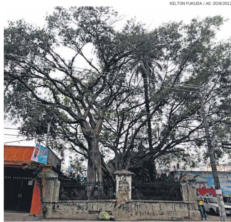
NILTON FUKUDA / AE-20/9/2012

Seleção. Sobre a escolha de focar a campanha em 20 árvores, Cardim diz que a decisão foi tomada porque esse é um número que as pessoas conseguem quantificar. “Claro que tem muitas outras que poderiam entrar na lista e a ideia é aumentar o projeto”, conta. “Além de São Paulo, outras cidades, como o Rio de Janeiro, também possuem árvores centenárias que merecem uma campanha como essa.”/M.F.