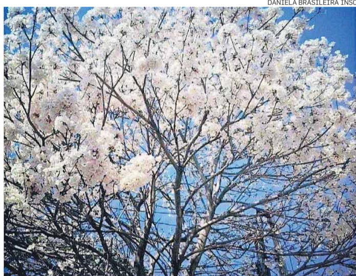
DANIELA BRASILEIRA INSONE

Contraste. Ipê-roxo entre os fios e prédios na Rua Adolfo Tabacow, no Itaim-Bibi, zona sul de São Paulo.