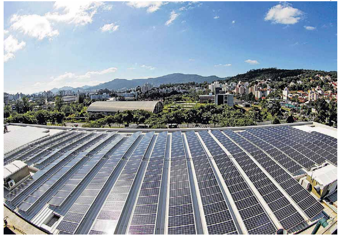
Projeto. Uma das interessadas no leilão, Eletrosul montou usina solar na própria sede

Expectativa. O ambiente para o próximo leilão, marcado para