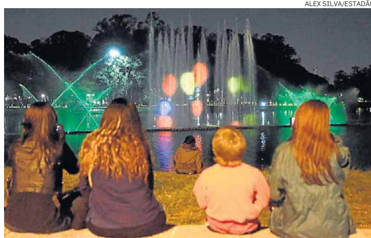
Ibirapuera. Festa de aniversário teve show de luzes

Como mostrou reportagem do Estado no dia 13, a ciclovia já instalada no centro se transformou em uma “motofaixa” no horário de pico. Em duas horas no período do rush, 158 motoqueiros invadiram a faixa da Avenida São João, trafegando em alta velocidade e até no que seria a “contramão” das bikes.