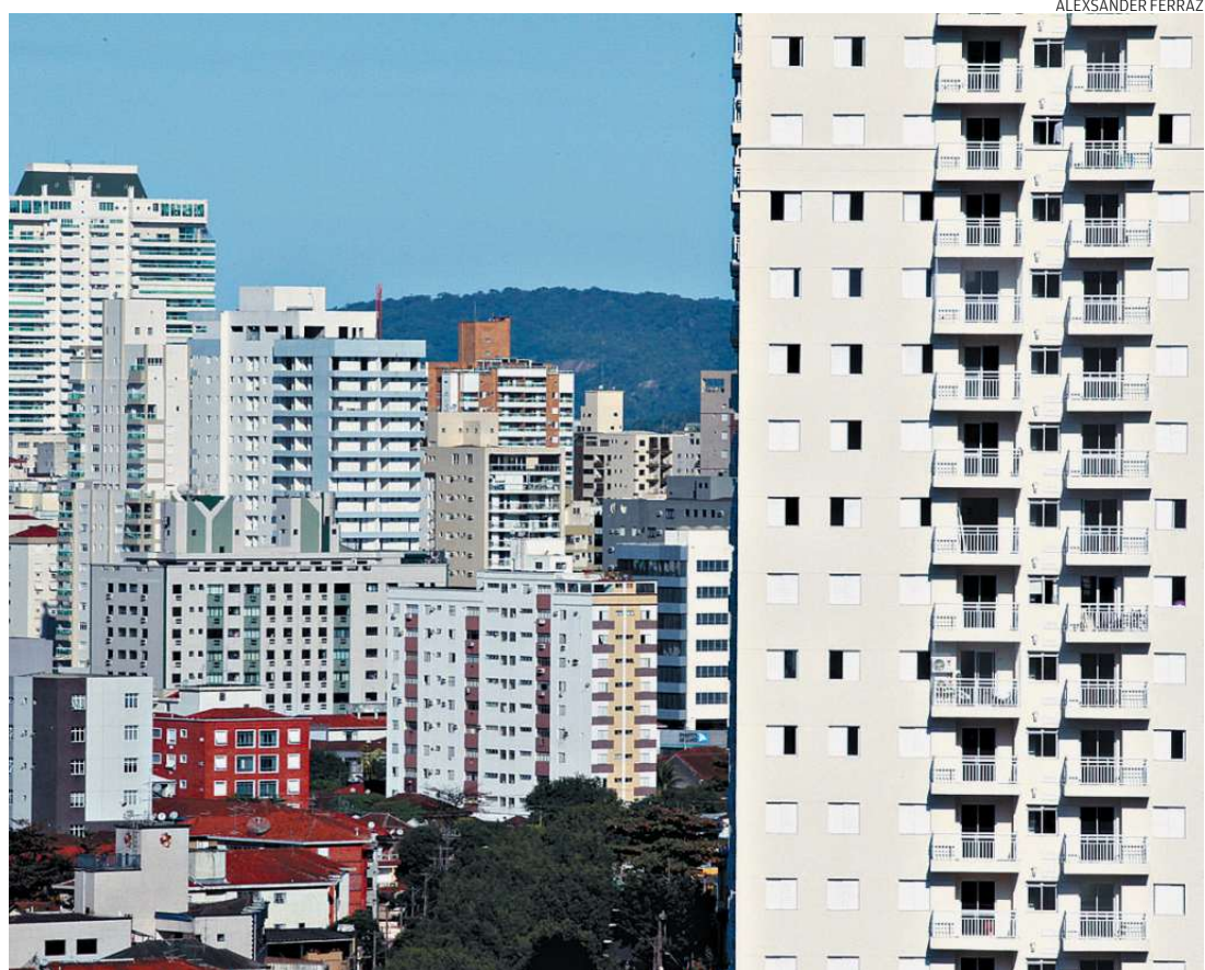
Mercado santista sente desaceleração do País, mas volume de projetos indica aposta em retomada

Essa antecipação é explicada pela expectativa dos construtores de que a nova lei será restritiva. Entre as propostas está a reserva de um recuo maior entre a calçada e o prédio, deixando mais espaço para o pedestre caminhar. Ou ainda que os edifícios terão