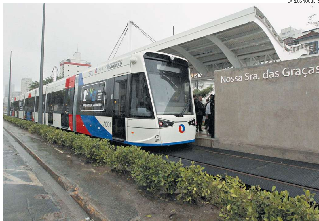
Os testes do novo modal devem ocorrer em agosto entre as estações do VLT localizadas em São Vicente

A empresa que venceu a licitação para desenvolver o Estudo de Impacto Ambiental e o Relatório de Impacto ao Meio Ambiente (EIA Rima) do VLT, a