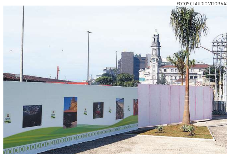
Perto do museu, a história de Santos, com armazéns e a Bolsa de Café