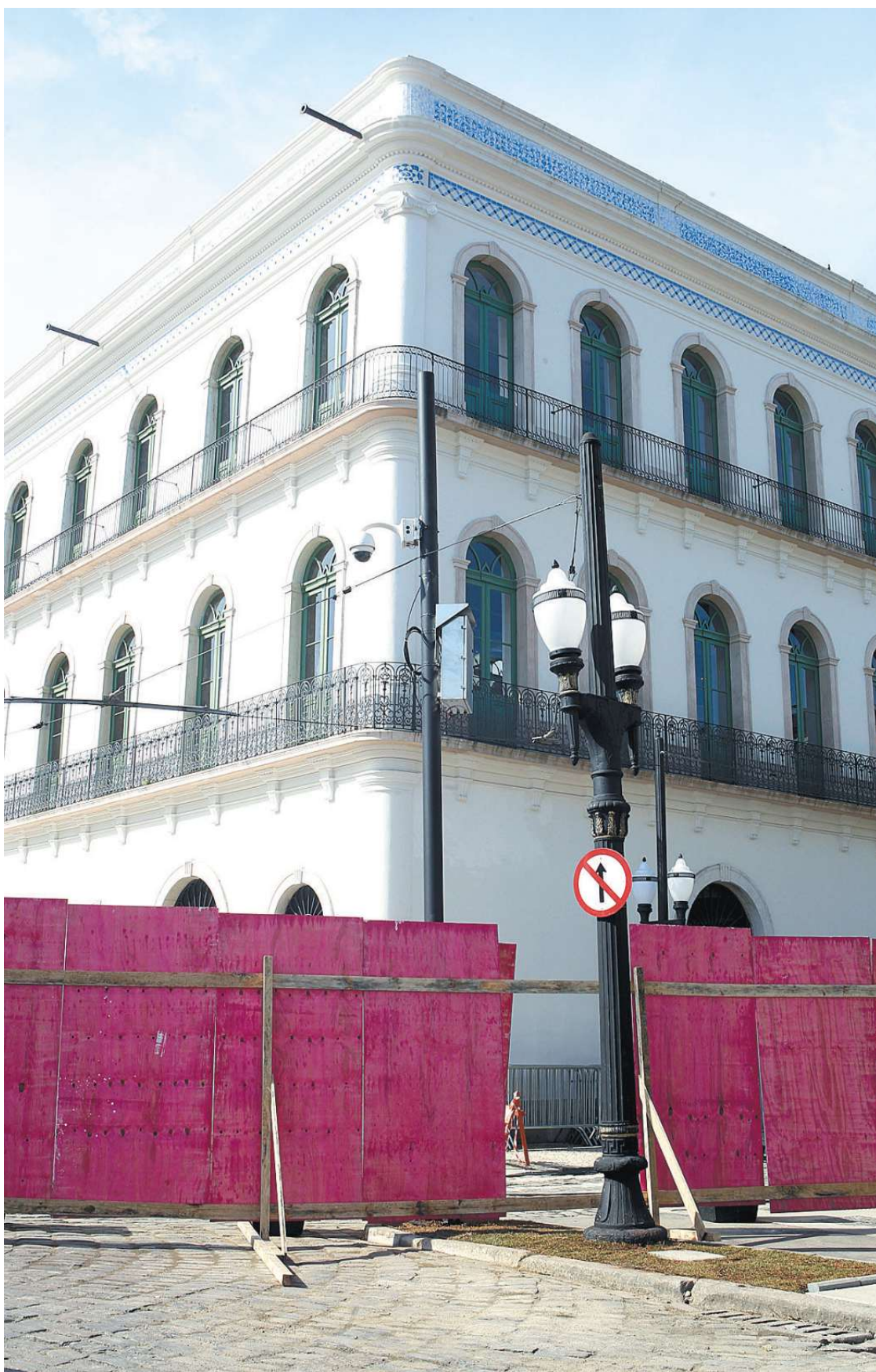
Casarão do Valongo, que estava em ruínas e do qual pouco restava em pé, foi completamente recuperado

Guarda Municipal e agentes da Companhia de Engenharia de Tráfego (CET). Para deixar o carro, ele sugere estacionamentos da região. “Os ônibus turísticos terão um bolsão na Avenida Perimetral”. Por causa do fluxo de visitantes, ele cogita ampliar o Restaurante Escola, diante do museu. “Ainda mais que, a partir de terça, haverá o Prato do Rei (arroz, feijão, picanha e farofa) em seu cardápio fixo”.