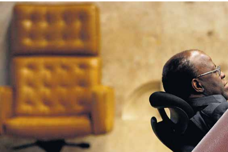
Ícone. Ambassador , a poltrona de Zalszupin para o Supremo, ao lado de Joaquim Barbosa