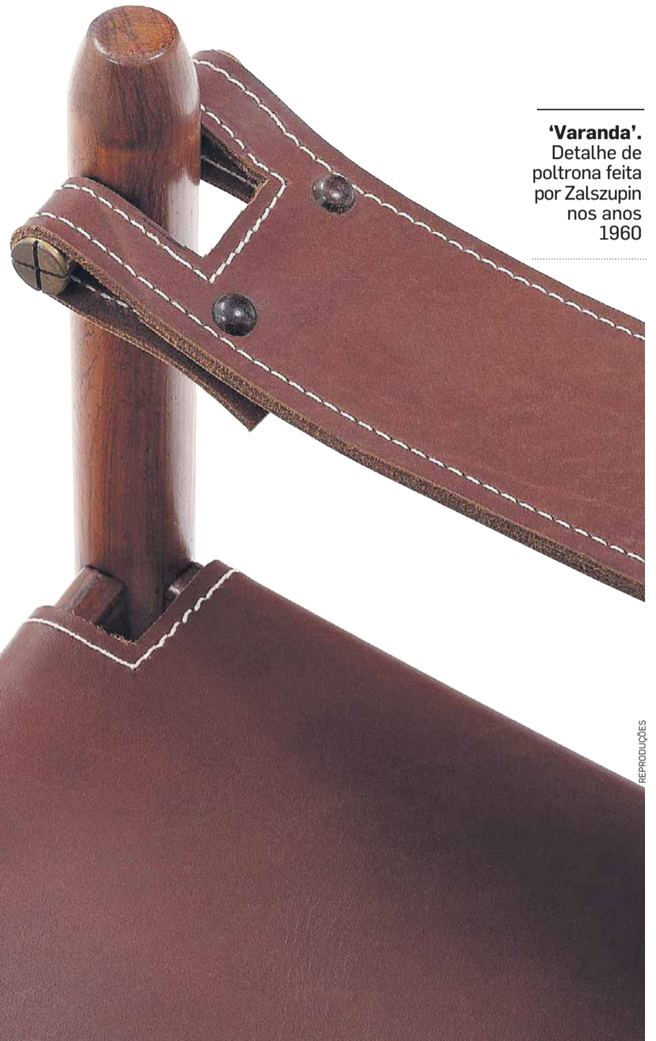
'Varanda'. Detalhe de poltrona feita por Zalszupin nos anos 1960

Design brasileiro dos anos 1960/70 é o tema de livros sobre visionários