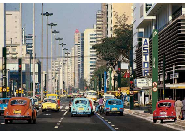
Nova Paulista. A avenida e os totens verticais há 40 anos