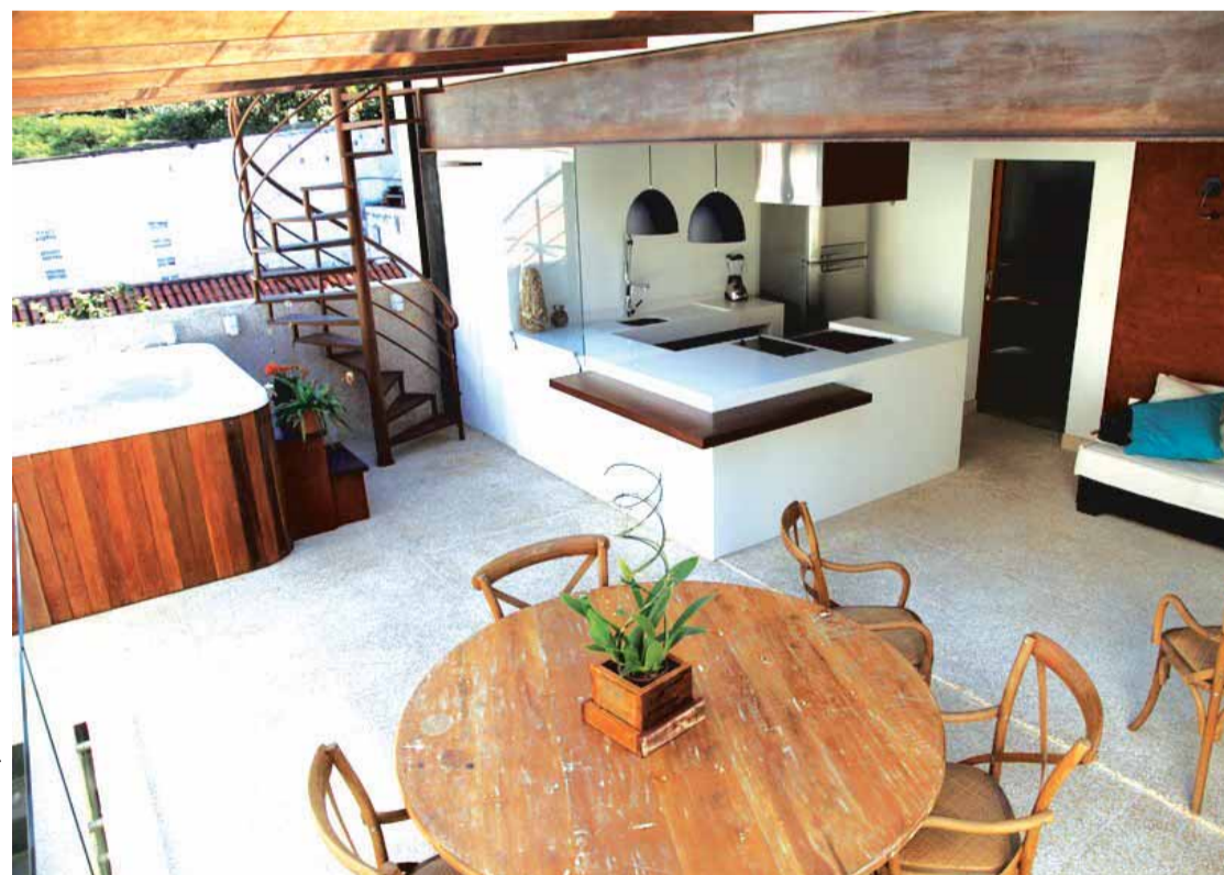
Casa sustentável de Rafael Loschiavo: a água que vem de cisterna, localizada no subsolo, irriga a horta, o jardim e o telhado verde, além de abastecer as caixas das descargas

Porém, em uma residência é preciso estar atento aos banhos demorados, responsáveis pela maior parte do desperdício. Dez minutos a mais sob o chuveiro consomem 100 litros de água potável.