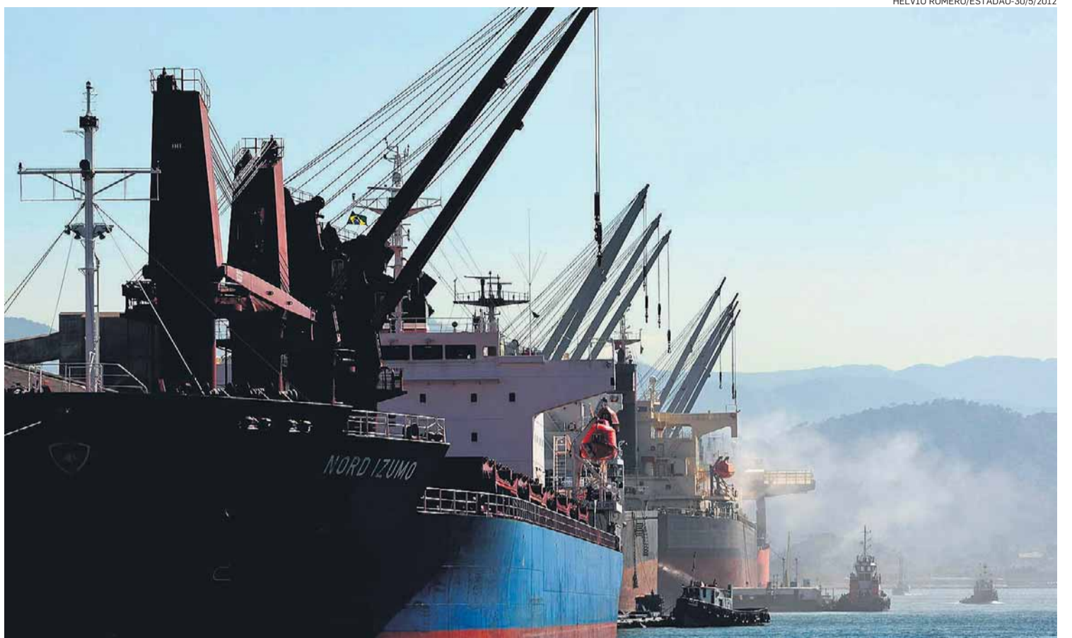
Ritmo descendente. Em 2007, o Porto de Santos tinha a quarta pior nota dada pelos profissionais; em 2009, a terceira

“Em relação às últimas pesquisas, todos apresentaram melhora... O complexo santista também melhorou, mas os outros evoluíram mais.”