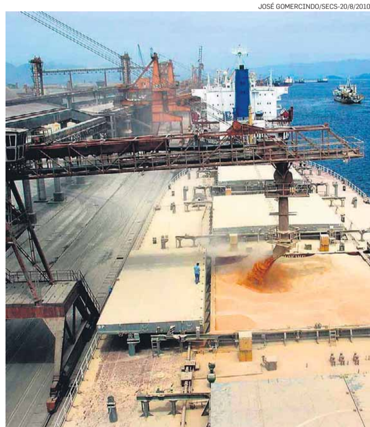
Logística. Paranaguá é uma das principais saídas da soja