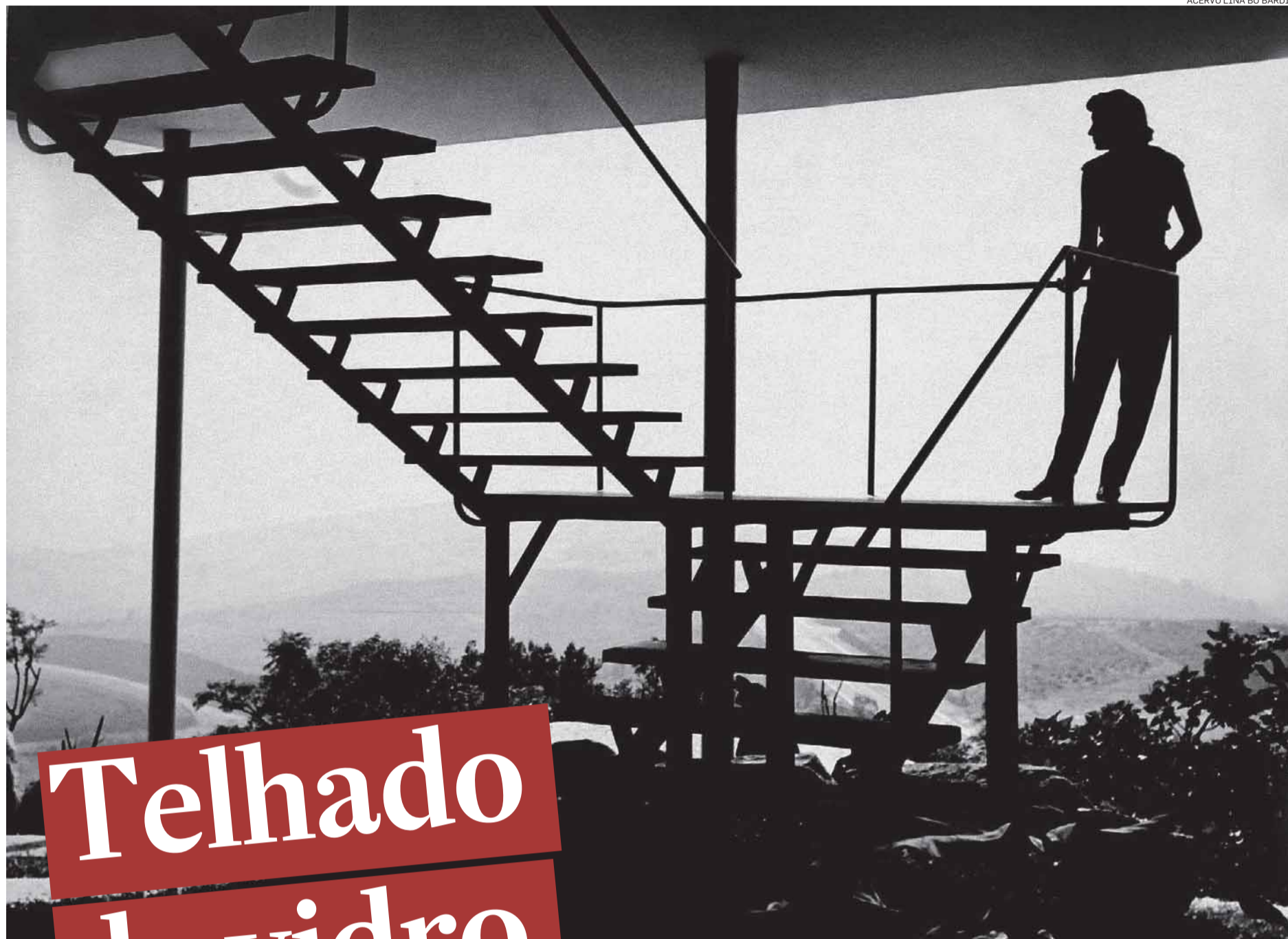
ACERVO LINA BO BARDI