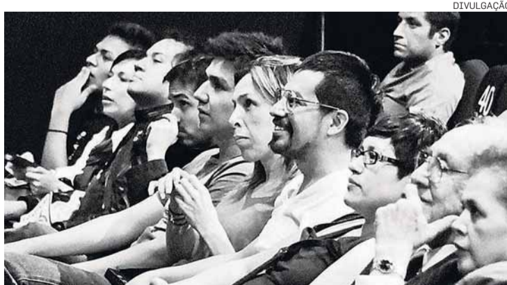
Na prática. Espectadores votam por controle remoto

São as respostas da plateia que fazem o espetáculo evoluir. Levando os participantes a ex-