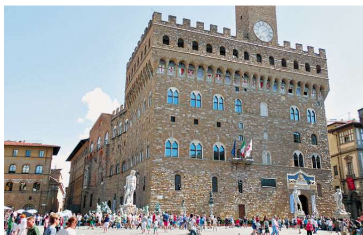
Na Piazza Della Signoria, com o Palazzo Vecchio, a estátua de Davi

partia da Uffizi , onde no passado ficava a sede dos negócios dos Médici, até o Palazzo Pitti, residência oficial dos governantes de Florença. O corredor é uma atração turística restrita, que até pode ser visitada, mas em dias e horários específicos. No seu interior há muitas obras de arte, além da expressão clara do medo que os nobres tinham das ruas.