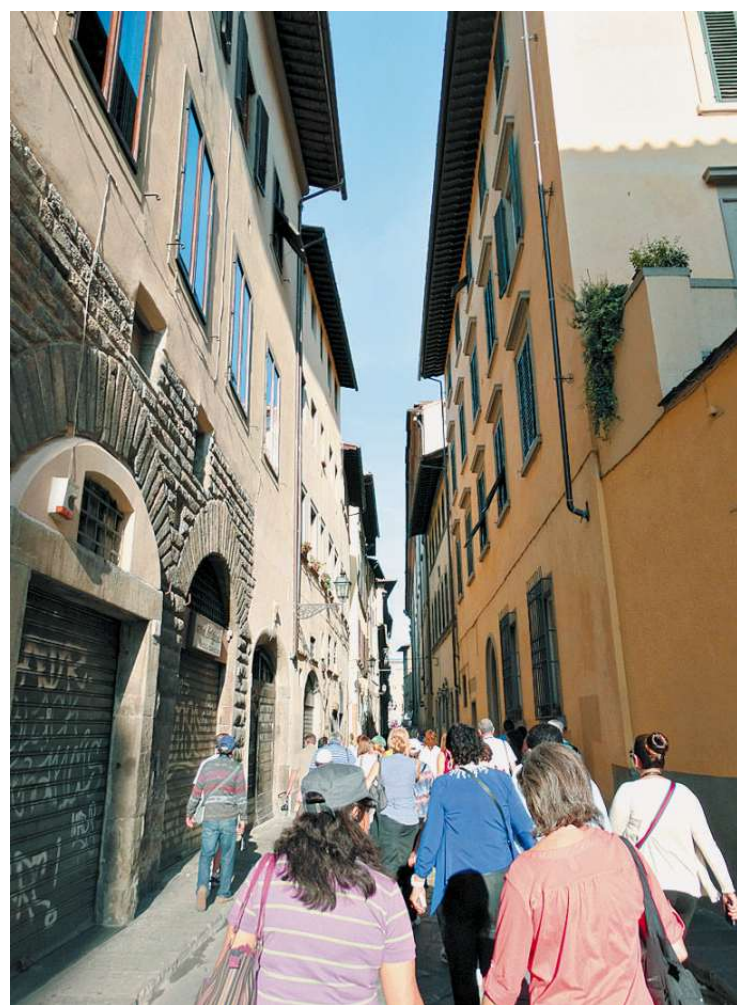
As vielas do Centro Histórico são tomadas pelos turistas: tour a pé