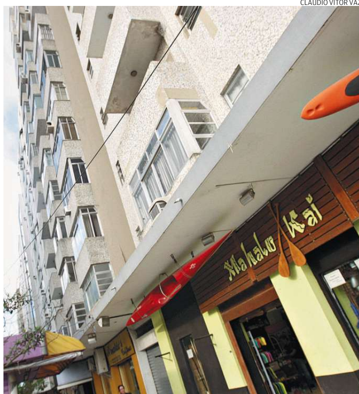
Rua Bassin Nagib Trabulsi, na Ponta da Praia: modelo a ser resgatado

É justamente esse cenário que a revisão da Lei de Uso de Ocupação do Solo quer mudar. "Ao olharmos várias partes da Ponta da Praia, Aparecida e Embaré, áreas entre as avenidas Pedro Lessa e Afonso Pena, podemos dizer que têm potencial