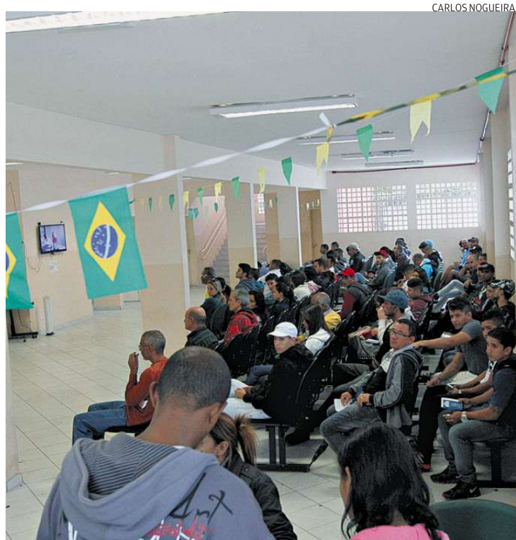
Posto de Atendimento ao Trabalhador (PAT): incentivo ao emprego

No setor de serviços, bem como em importante fatia das atividades comerciais, destacam-se transporte e armazenagem, em razão do Porto de Santos e sua movimentação de cargas. Turismo está dentro desse todo.