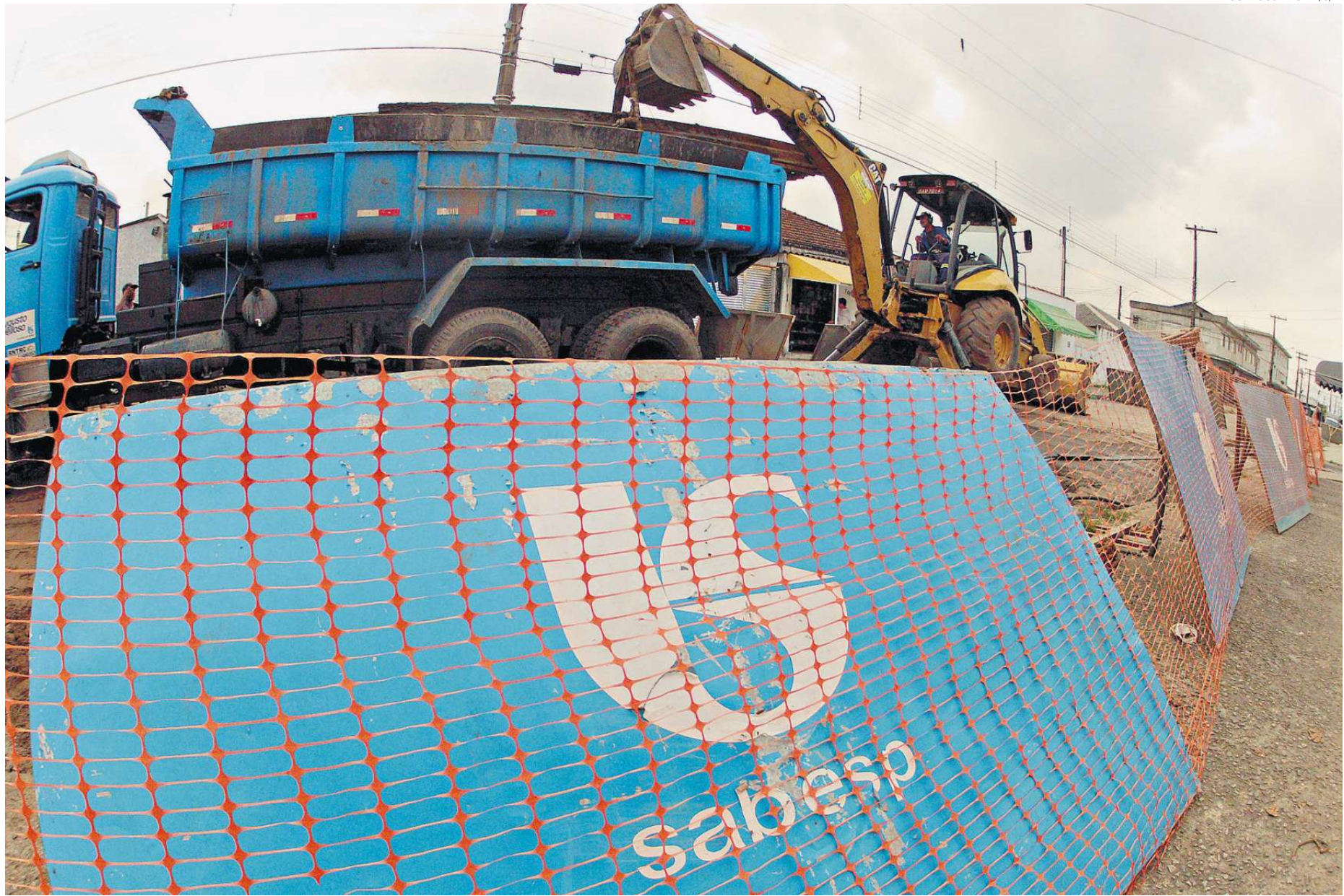
Plano Metropolitano estipula o objetivo de, até 2030, atender a toda a Baixada Santista com serviços de tratamento e distribuição de água e coleta e processamento de esgoto

O levantamento incluiu a presença média da população flutuante, correspondente a 40% do total em todos os finais de semana e o crescimento contínuo do resíduo produzido per