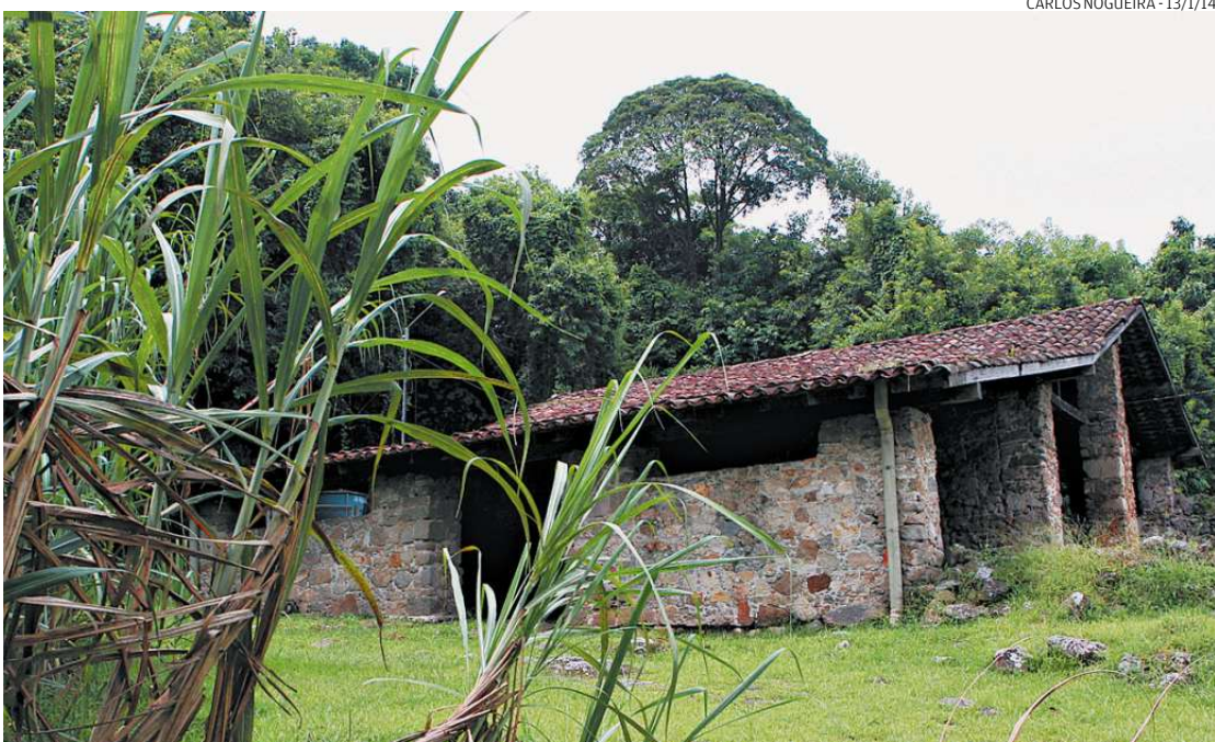
CARLOS NOGUEIRA - 13/1/14