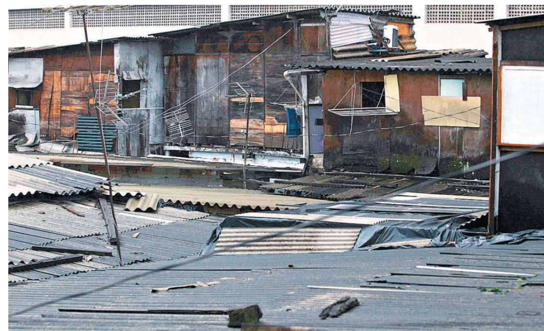
Conjunto habitacional será erguido no terreno em frente ao local onde vive a comunidade atualmente