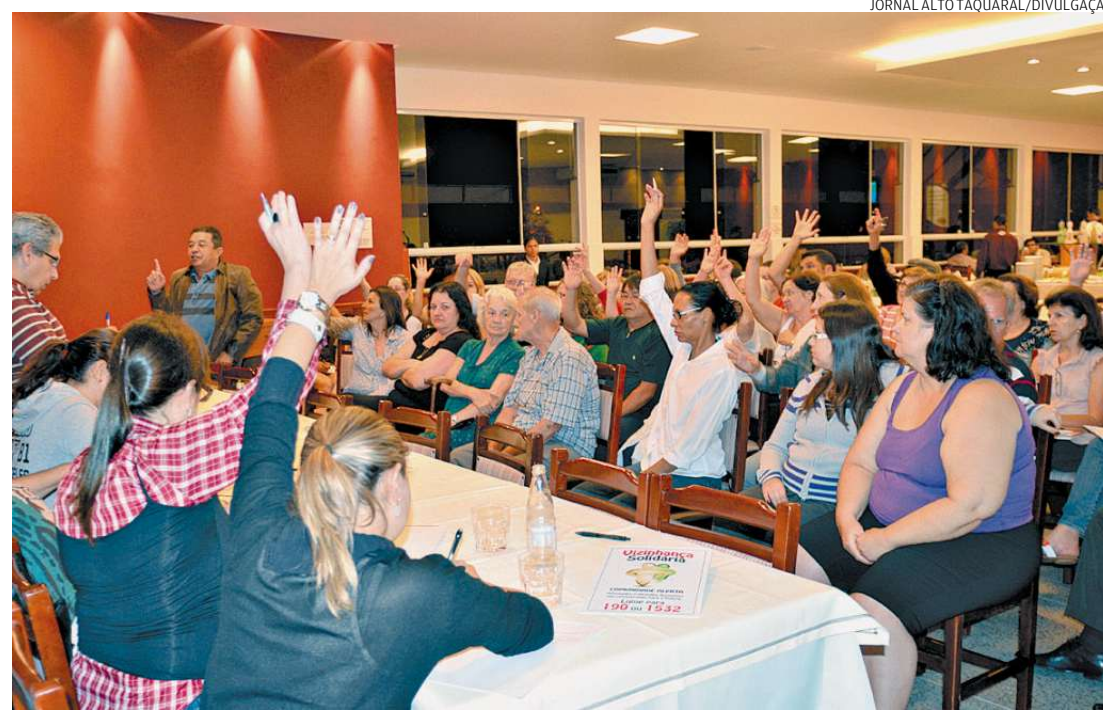
Em Campinas, criminalidade caiu logo no primeiro mês de introdução do programa. Quase não há roubos

mente fazendo rondas no bairro. Mas há outros benefícios decorrentes da iniciativa.