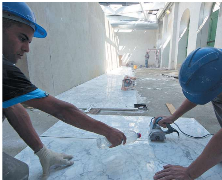
Mais de 100 funcionários trabalham no local, que recebe piso italiano

Com início em 2010, as obras tiveram orçamento de R$ 45 milhões - R$ 9,8 milhões do Ministério do Turismo e R$ 2 milhões do Governo Estadual.